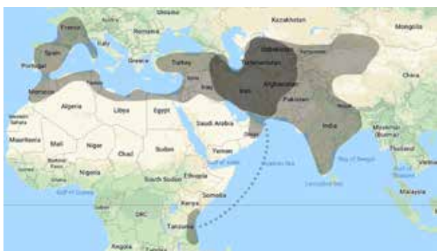
تصویر ۱۴. قلمرو سرزمینی ایران و محدوده اثرگذاری باغ ایرانی.

این تحقیق امکان بسط و تکامل دارد. بدیهی است که تنها چند مورد مختصر از جوانب و شئون فرهنگی باغ ایرانی که در جهان گسترش یافته در این نوشته ذکر شده است. بنابراین برای شناخت بهتر میراث باغ ایرانی نیاز به پژوهش‌های گسترده‌تری است تا عمق نفوذ این محصول فرهنگی در جهان آشکار شود.