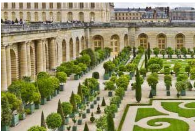
تصویر ۷. نقوش اسلیمی (آرابسک) در میان نارنجستان در باغ ورسای فرانسه.

به‌نظر می‌رسد که قالی‌های ایرانی با طرح باغ (تصویر ۸) از طریق جاده ابریشم به سرزمین‌های اروپایی راه یافته و سپس منبع الهام باغسازان دوره رنسانس از جمله «آندره لونوتر» واقع شده است.