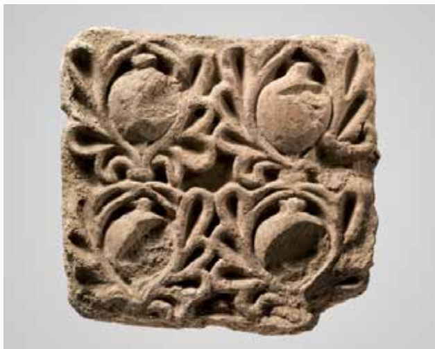
تصویر ۳. نقش انار در دیوارهای کاخ تیسفون، دوره ساسانی.

دومین عامل انتقال این نقوش را می‌توان در قالی ایرانی جست‌وجو کرد. قالی‌های ایرانی از دیرباز بازتاب باغ ایرانی بوده‌اند و «قالی‌های باغی» یکی از دسته‌های اصلی قالی ایرانی محسوب می‌شود (تصویر ۸).