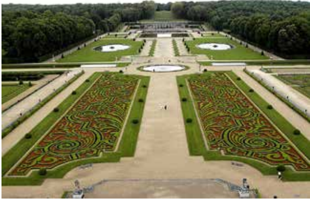
تصویر ۵. باغ ولوویکنت که نخستین باغ به سبک فرانسوی محسوب می‌شود و دارای هزار اصله درخت مرکبات بوده است. مأخذ: www.gardenvisit.com

بزرگترین تأثیر را بر غرب و شرق می‌گذارد (Anuarbe, 2003). او از مجموعه «مدینه الزهراء» در نزدیکی کوردوبا به‌عنوان مثالی در این زمینه نام برده و اعتقاد دارد که این سنت همچنان در فرهنگ آندلس حفظ شده و بر فرهنگ کاربرد آب و سیستم‌های آبیاری پس از خود در اروپا تأثیرگذار بوده است.