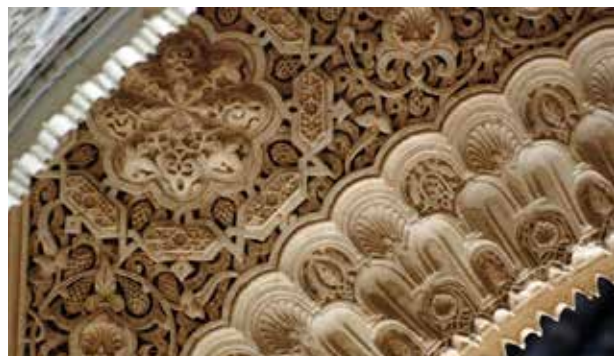
تصویر ۶. نقش اسلیمی (آرابسک) در کاخ الحمراء، گرانادا، اسپانیا.