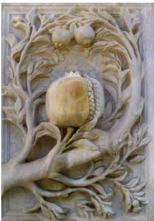
تصویر ۴. نقش انار در مجموعه الحمراء، گرانادا، اسپانیا.