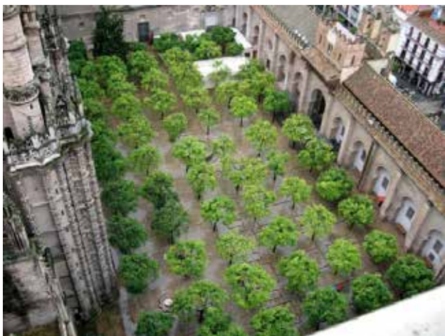
تصویر ۱. نارانجستان کلیسای جامع شهر سویل، اسپانیا.