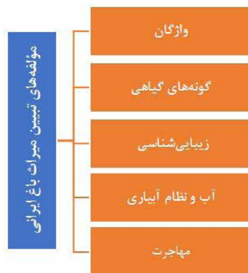
تصویر ۱۳. مؤلفه‌های مورد استفاده برای تبیین میراث باغ ایرانی.

و اسپانیا اثرگذار بوده است. نظام آبیاری و چشمه عمارت‌ها در هر دو سرزمین مشابه باغ‌های ایرانی است و تأثیرپذیری آنها انکارناپذیر است.