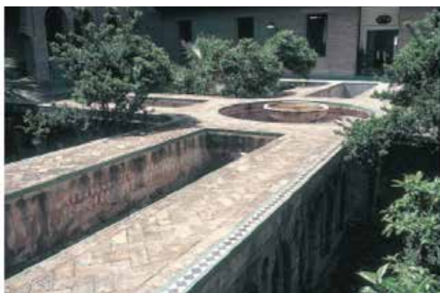
تصویر ۱۵. راست: مینیاتور مربوط به دوره گورکانیان. چپ: مصداق ساخته‌شده آن در مجموعه الکزر شهر سویل اسپانیا.