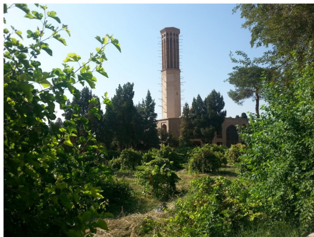
تصویر ۵: باغیانی منظرساز در باغ دولت‌آباد یزد. عکس: سید محمدرضا خلیل‌نژاد، ۱۳۹۶.

منظر و طراحی محیط‌های شهری می‌توان یافت. اوج این افول را در باغ فین کاشان می‌توان دید که درختان میوه بومی و ایرانی جای خود را به سطوح چمنی با بذرهای خارجی داده‌اند. این وضعیت امروز جامعه ماست. جامعه‌ای که با دارا بودن یکی از استثنایی‌ترین اقلیم‌های حیاتی در محدوده مرزهای فیزیکی و معرفت فلاحی در محدوده مرزهای فرهنگی خویش می‌تواند متنوع‌ترین شیوه‌های منظرسازی مثمر را احیا نموده و با رویکردی اقتصادی-بوم‌شناختی و رای آرایش صوری محیط، به آرایه‌های باطنی فرهنگ خویش گوش فرا دهد.