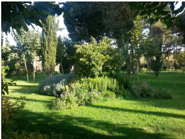
تصویر ۴: گل‌کاری، چمن‌کاری و کاشت درختچه‌های گسترده در باغ چهلستون اصفهان. عکس: سید محمد رضا خلیل‌نژاد، ۱۳۹۶.