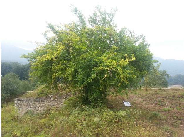
تصویر ۲: درختچه خودروی انار در باغ عباس‌آباد بهشهر.