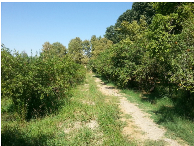
تصویر ۶: منظر مثمر در باغ پهلوان پور مهریز. عکس: سید محمدرضا خلیل‌نژاد، ۱۳۹۶.