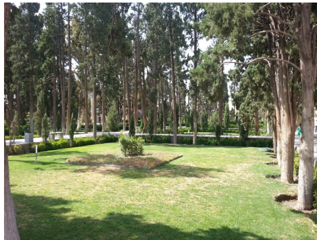
تصویر ۳: تغییر کاربری کرت‌های میوه‌کاری به سطوح چمن‌کاری در باغ فین کاشان. عکس: سید محمد رضا خلیل‌نژاد، ۱۳۹۶.