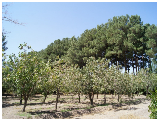
تصویر ۱: کرت پسته در باغ اکبریه در بیرجند. ناظر علاوه بر منظر تولیدی در پیش‌زمینه، منظر زینتی پس‌زمینه (محور اصلی) را نیز می‌بیند. عکس: سید محمدرضا خلیل‌نژاد، ۱۳۹۶.

پُرکردن فضای باغ و ایجاد مجموعه‌ای سبز و زیبا نیست؛ بلکه هر جزء وظیفه‌ای در این نظام بر عهده دارد که با حذف یا تغییر نابه‌جای آن، کل دچار اختلال در عملکرد می‌شود.