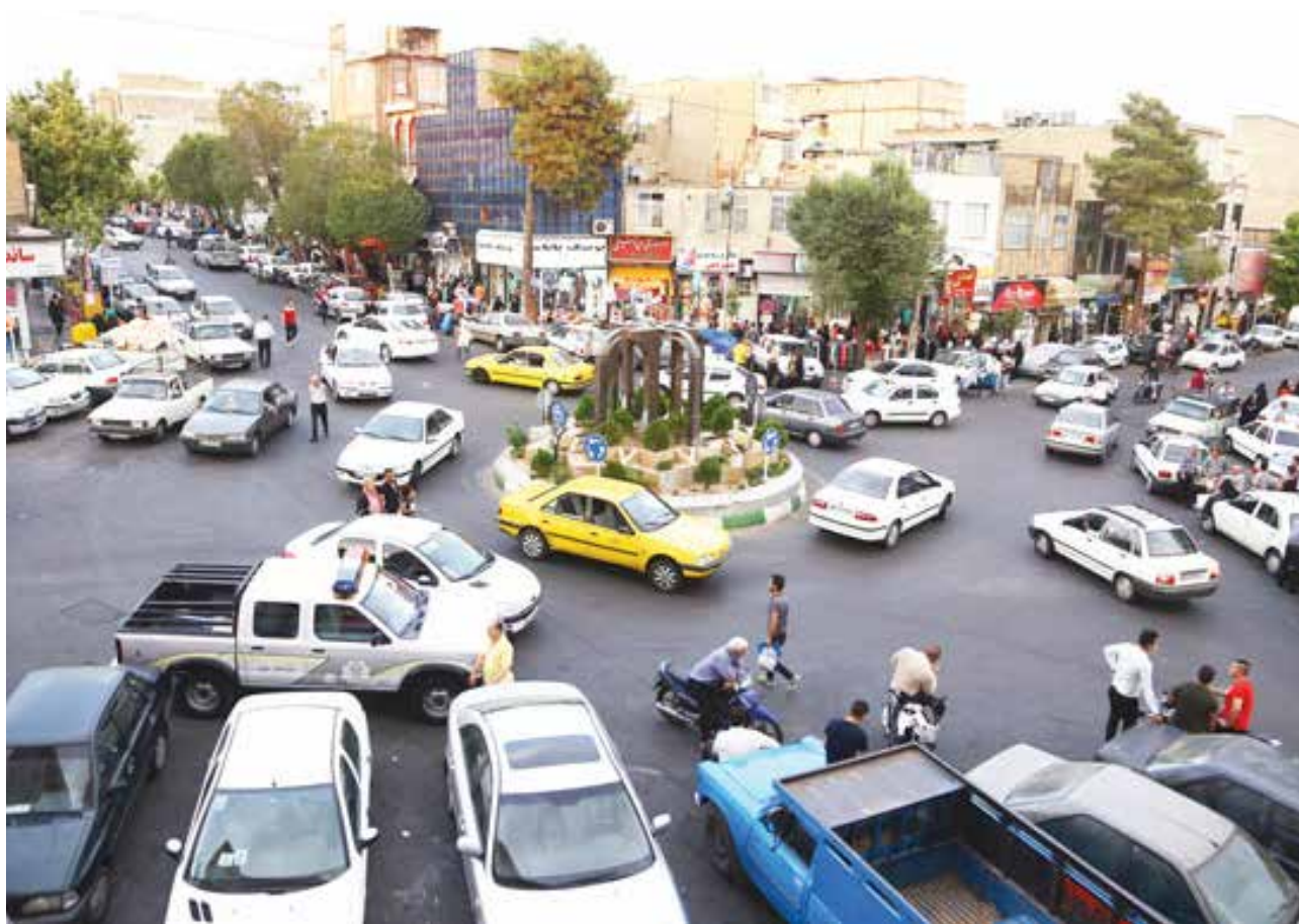
تصویر ۲: میدان برادران پاک‌دامن، محله شمیران نو.

«...» [همیشه شبا می‌ریم تو اون مسجد، خیلی هم خوبه. چهارشنبه‌سوری می‌شه، جرأت نمی‌کنی بری سر میدون. فک