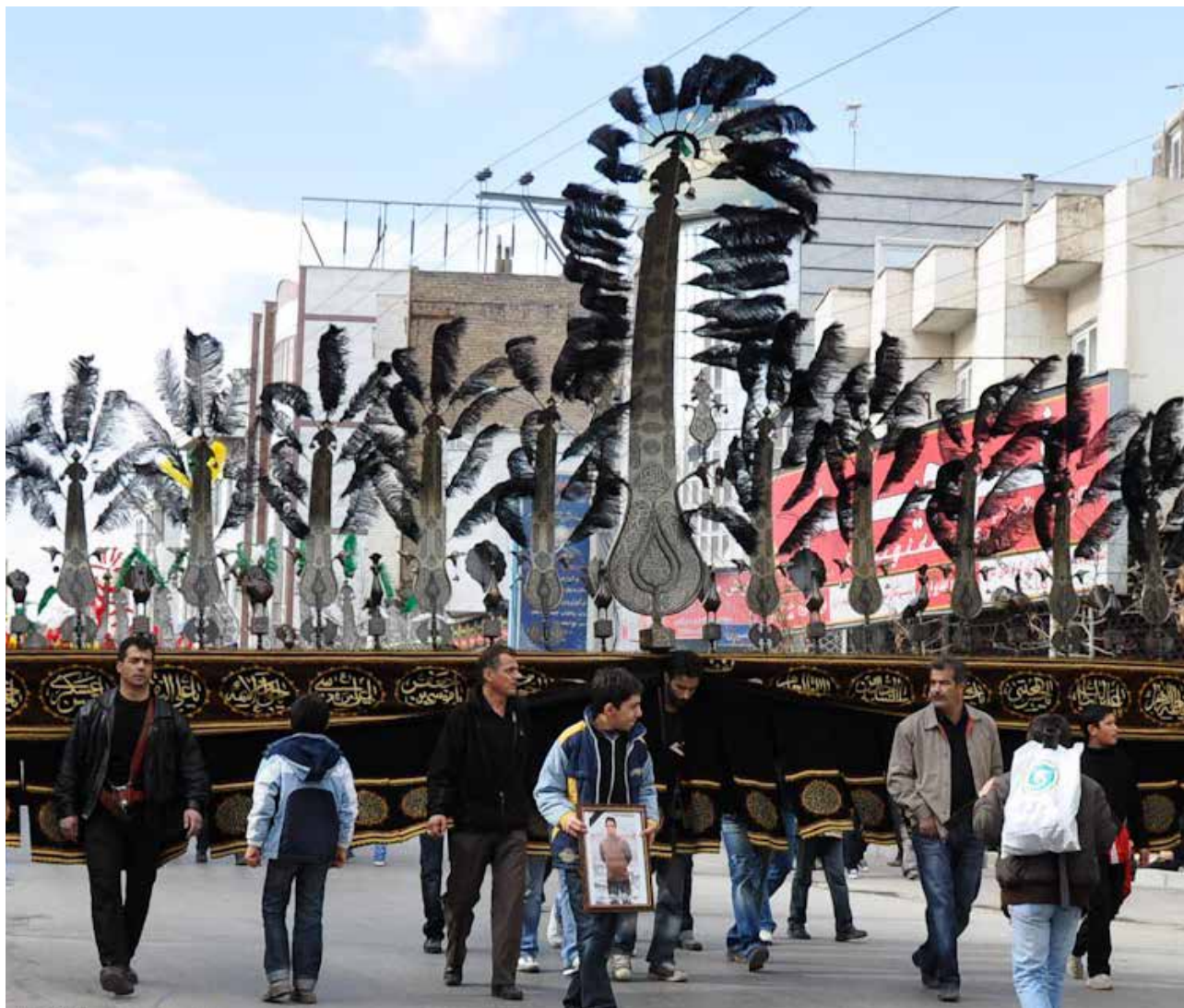
تصویر ۴: دسته‌های عزاداری در شمیران نو. عکس: امید جعفرنژاد، ۱۳۹۳.

هم‌محلی‌های خود را می‌بینند و تشکل‌های مذهبی و اعتقادی برگزار می‌کنند. در پاسخ به سؤال فرعی که این ساکنین چه بخشی از محله را مرکز می‌دانند می‌توان به پیشینه و قدمت مرکزیت محله و تاریخچه کالبدی آن اشاره کرد. هسته مرکزی توسعه محله و مرکز تأمین آب خانوارها هرچند تغییر ماهیت و شکل داده است، اما همچنان مزیت کارکردی و ماهیتی خود را از دست نداده است. به عبارتی در هر دوره زمانی این مرکز نقش‌های کارکردی متفاوتی را بر عهده گرفته است که تجمع ساکنین را در پی داشته و به فراخور نیازهای اجتماعی کانون تجمعات محله بوده است. مرکز دسترسی به آب، مرکز تجمعات انقلابی، مرکز رویدادهای مذهبی-فعالیت‌های اقتصادی، مرکز خرید و فروش و مرکز رفت‌وآمد و دسترس‌پذیری چیزی است که در سیر تکامل محله قابل مشاهده است. جای توجه دارد که در شرایط حاضر سه مؤلفه