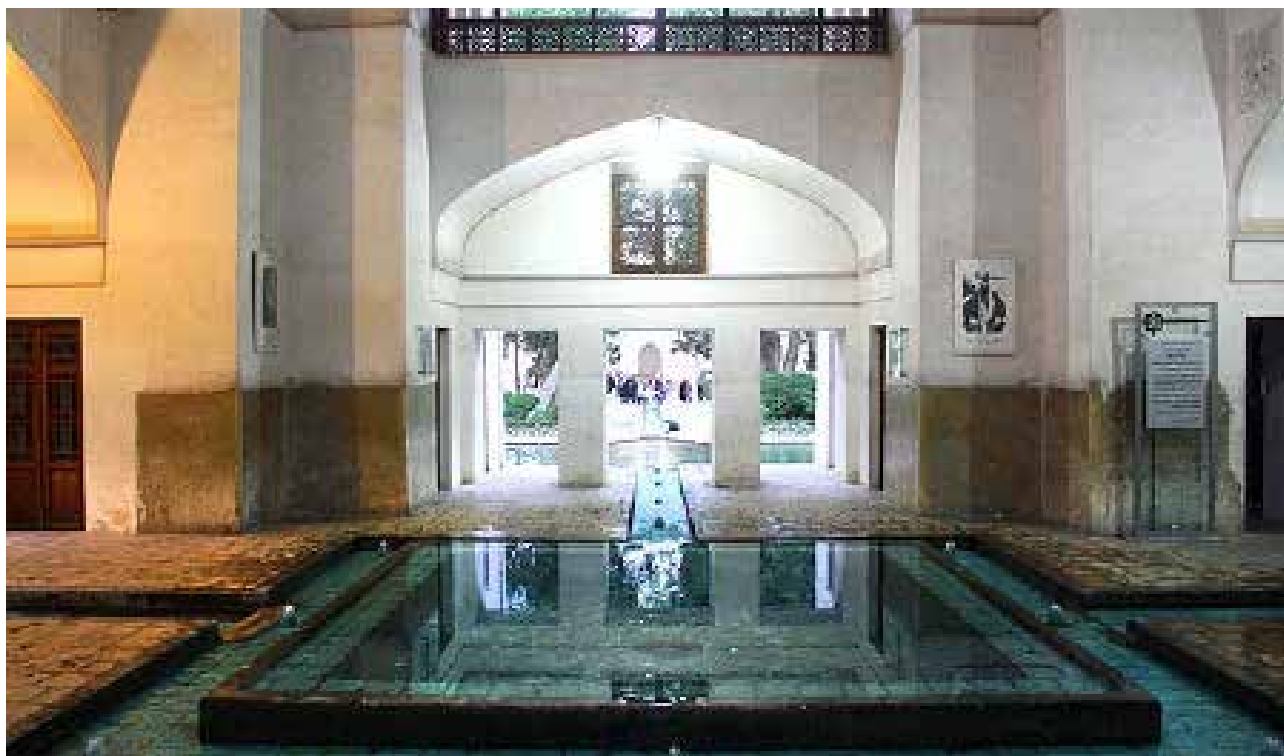
تصویر ۲: باغ فین، کاشان.

زیر (درختان و قصرهای) آن (نه زیرزمین آن) جوی‌های آب (به مراد و امر بهشتیان) جاری است ۴ یا شاخه‌های درختانش بر آب‌ها سایه افکنده و آب‌ها زیر آنها قرار گرفته است. همچنین در چهار آیه، بهشت‌های زمینی با نهرهای جاری آمده است.