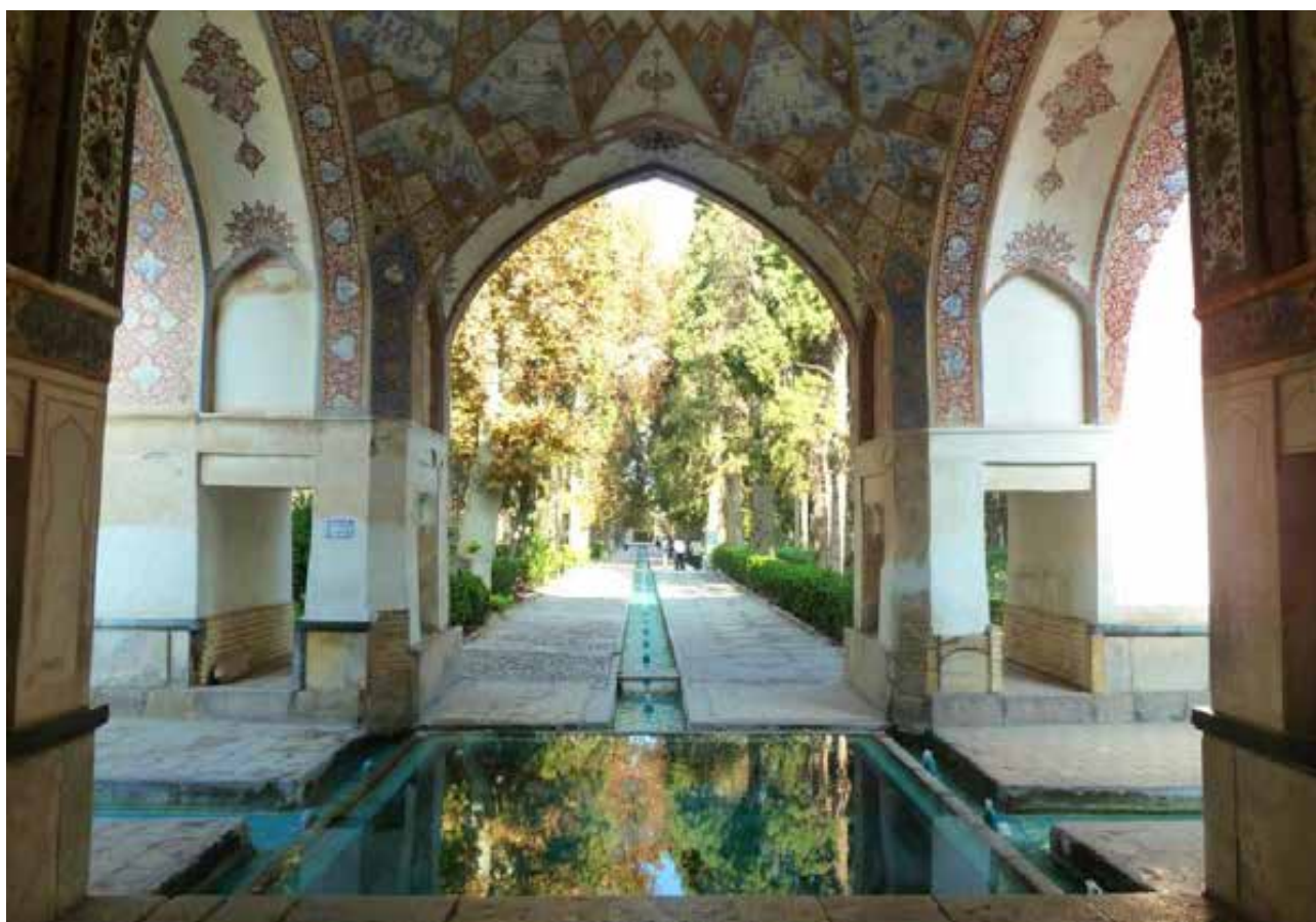
تصویر ۳: باغ فین، کاشان.