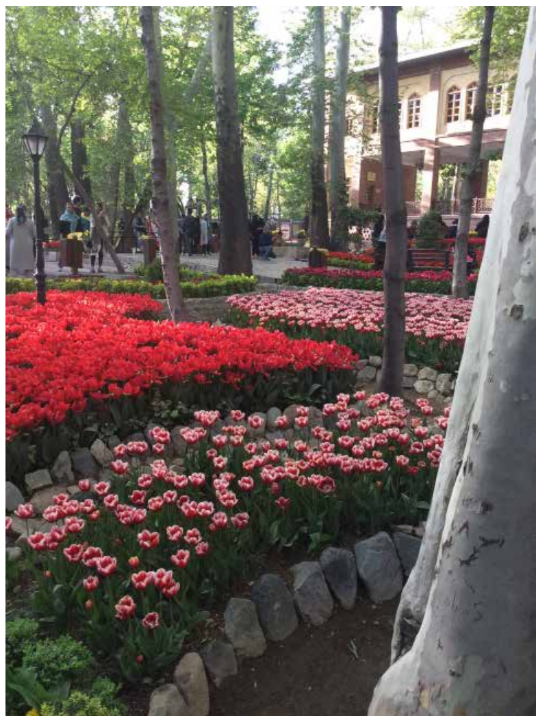
تصویر ۱: بوستان باغ ایرانی ده ونک، تهران.

براساس آموزه‌های دین اسلام گیاهان از ارزش و اهمیت ویژه‌ای برخوردار هستند؛ تا جایی که در قرآن، بهشت - بهترین مکانی است که به انسان‌های پرهیزگار وعده داده