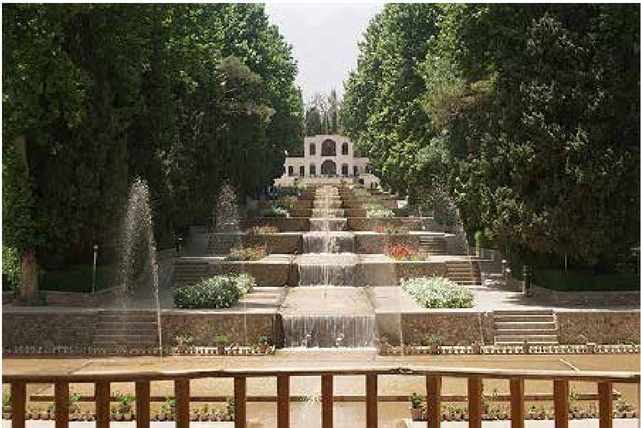
تصویر ۴: باغ شاهزاده ماهان، کرمان.

می‌سازد که هر ایرانی، خویش و فرهنگ و ارزش‌ها و حیات خود را در آن منعکس می‌بیند. خویش را جزئی از آن و آن را جزئی از خویش دانسته و احساس یگانگی و وحدت با باغ می‌نماید. روش‌های به کار رفته در باغ ایرانی به منظور القا و تقویت هویت را می‌توان شامل به کارگیری فرم‌های آشنایی که ریشه در فرهنگ و هنر باستان ایران دارد و همچنین استفاده از عناصر نمادین و معنادار که غالباً مرتبط با باورهای مذهبی است دانست. از دسته اول عناصر می‌توان از فرم‌هایی چون چهارباغ با سابقه تاریخی چندین هزارساله نام برد. دسته دوم از عناصر آنهایی هستند که یادآور بهشت و تجسم یافته زیبایی‌های توصیف شده از آن در قرآن هستند که از آن جمله می‌توان به مفهوم فردوس یا چشمه‌های جوشان و... در باغ ایرانی اشاره کرد. جدول ۲ چگونگی تجسم توصیفات قرآن از بهشت در باغ ایرانی را نمایش می‌دهد.