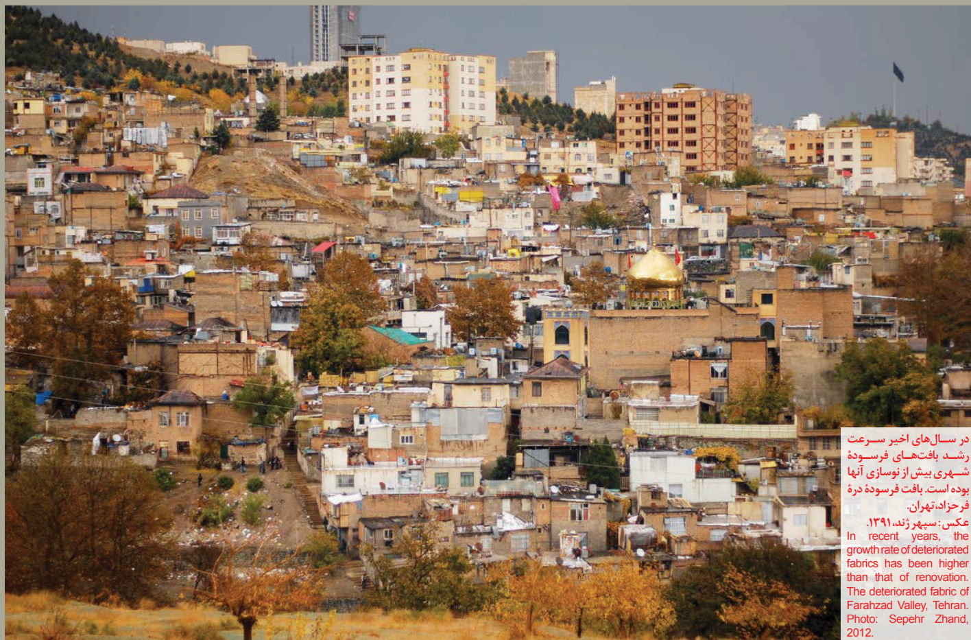
در سال‌های اخیر سرعت رشد بافت‌های فرسوده شهری بیش از نوسازی آنها بوده است. بافت فرسوده دره فرحزاد، تهران.

• مقاله «آسیب‌شناسی نوسازی شهری در ایران» با تکیه بر تجارب میدانی، به آسیب‌شناسی و بررسی دلایل عدم تحقق نوسازی بافت‌های فرسوده شهری می‌پردازد که عمدتاً شامل سامان‌نیافتگی، دید پروژه‌محور و بخشی‌نگری است. ماهیت چندبعدی مسئله، فقر دانش در موضوعات مبنایی نوسازی، شکاف میان توسعه ملی و توسعه شهری، انعطاف‌ناپذیری طرح جامع و فاصله میان اهداف آن با طرح‌های نوسازی، فقدان