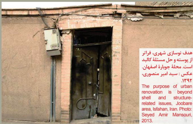
هدف نوسازی شهری، فراتر از پوسته و حل مسئله کالبد است. محله جوباره اصفهان. عکس: سید امیر منصور، ۱۳۹۲. The purpose of urban renovation is beyond shell and structure-related issues, Joobare area, Isfahan, Iran. Photo: Seyed Amir Mansouri, 2013.