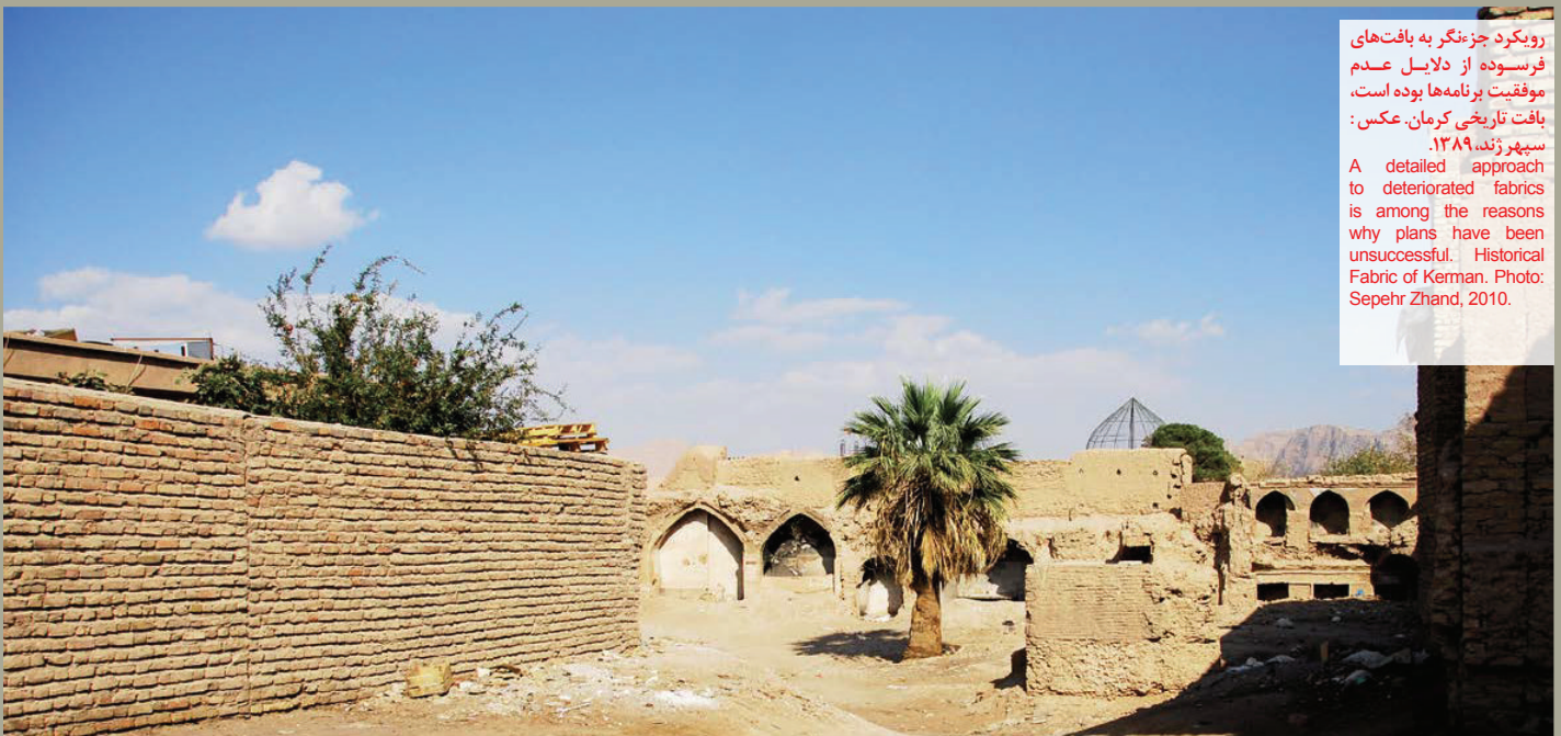
رویکرد جزء نگر به بافت های فرسوده از دلایل عدم موفقیت برنامه ها بوده است. بافت تاریخی کرمان. A detailed approach to deteriorated fabrics is among the reasons why plans have been unsuccessful. Historical Fabric of Kermandeh, Iran.