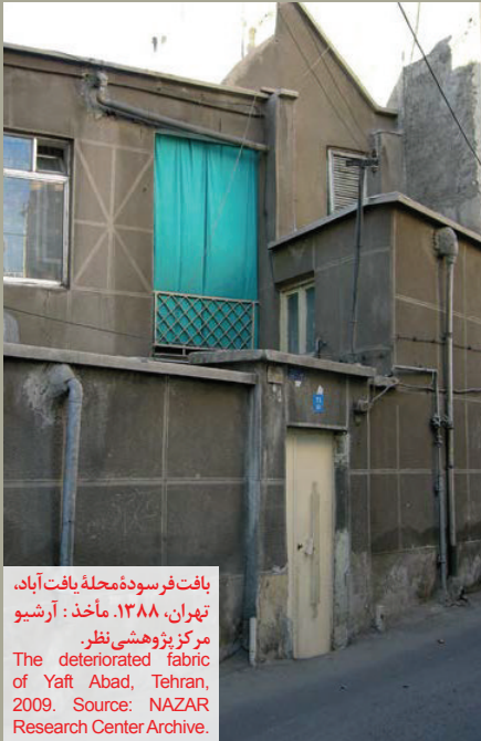
بافت فرسوده محله یافت آباد، تهران، ۱۳۸۸. The deteriorated fabric of Yaft Abad, Tehran, 2009.