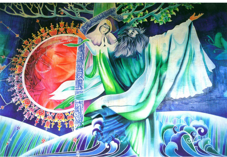
تصویر ۲: دیوارنگاری با مضامین ادبی و معرفتی، روش اجرا: رنگ روی پوشش سیمانی.