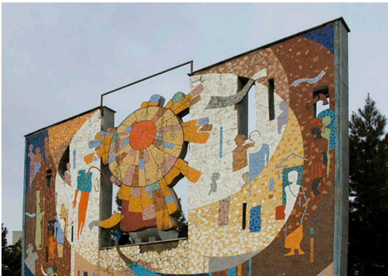
تصویر ۷: دیوارنگاری با مضمون فرهنگی، روش اجرا: موزاییک با قطعات کاشی.

منظر شهری و هویت‌مندی آن بیش از زیباسازی شهری از کارکردهای دیوارنگاری بهره می‌برند و این مسئله نشان از تأثیرات بطئی و عمیق دیوارنگاری در منظر شهری دارد.