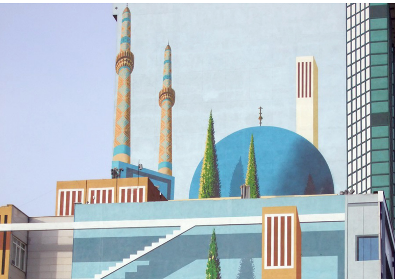
تصویر ۶: دیوارنگاری با مضمون مذهبی، روش اجرا: رنگ روی پوشش سیمانی.