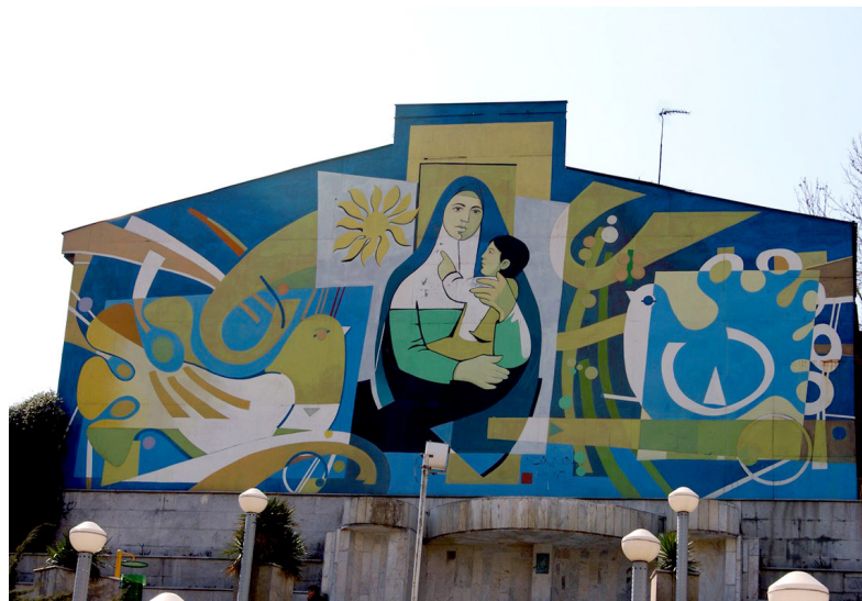
تصویر ۵: دیوارنگاری با موضوع مادر، روش اجرا: رنگ روی ورق‌های فلزی.

برخورد دارند که هم بر رویکرد عینی منظر شهری و هم بر رویکرد ذهنی آن تأثیر می‌گذارند. دیوارنگاری شهری به‌عنوان شیوه‌ای از هنرهای تجسمی می‌تواند رسالت این نوع از هنر را در فضای شهری اجرا کند. ظرفیت‌های این هنر به‌طور بارز از طریق فرآیندهای زیر، در خصوصیات بنیادین منظر شهری شامل «خوانایی»، «هویت‌مندی» و «زیبایی» (نمودار ۱) اثرگذار است: - تولید و ارائه معنای منجر به هویت و جذابیت و اعتباربخشی به هویت موجود