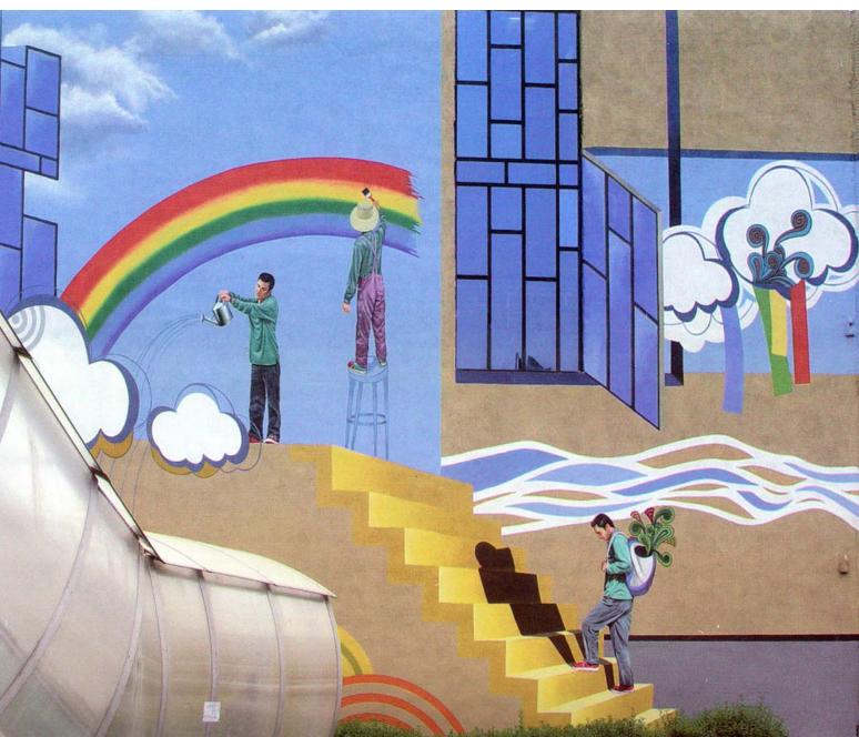
تصویر ۴: دیوارنگاری با مضمون سورئالیستی، روش اجرا: رنگ روی پوشش سیمانی.