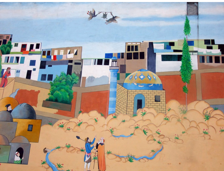
تصویر ۱: دیوارنگاری بر مبنای داستان‌های عامیانه، روش اجرا: رنگ روی پوشش سیمانی.