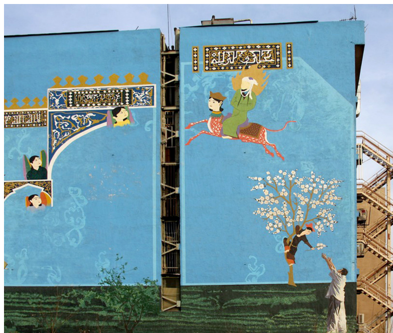
تصویر ۳: دیوارنگاری با مضامین عرفانی و معرفتی، روش اجرا: رنگ روی پوشش سیمانی.