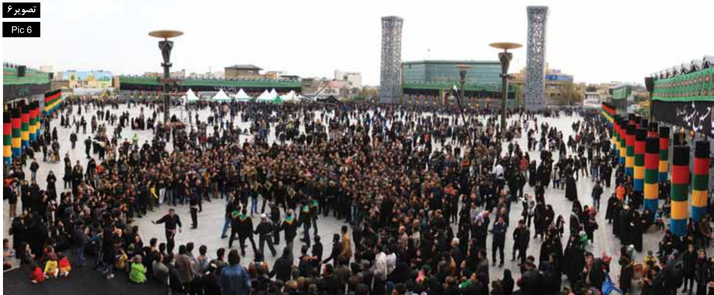
Pic6: Imam Hossein Square has performs as a communal space in days of Moharram for mourning ceremony, which is limited only in this period of time, Tehran, Photo: Amir Saberi Rad, 2013.

پاریس قرار دارد. میدان تیان آن من علی‌رغم قرارگیری در مرکز جغرافیایی پکن، نتوانسته با مرکز فعالیت شهر ارتباط برقرار کند و گویی تنها دلیل احداث آن، جلب توجه مردم به بناهای اطراف بوده است. در حالی که مرکز محله لب‌حوض با قرارگیری در قلب محله‌های مسکونی و پیوند آن با بازارچه، عبادت‌گاه و مدرسه دلیلی پررنگ برای حضور مردم دارد: انجام امور روزانه؛ عبادت، تحصیل، خرید، کار، تفریح، دیدار سایرین و ... در رویکرد انسان‌گرایانه اسلامی، شکل‌گیری فضای جمعی براساس خواسته‌ها و زندگی مردم است حال آنکه در دو نمونه دیگر همه چیز از پیش تعیین شده است و استفاده‌کننده تنها در چارچوب‌های تحمیلی فضا قرار می‌گیرد. به نظر می‌رسد تفاوت‌های حائز اهمیت و هویت‌دهنده به فضای جمعی، محصول سه مکتب فکری مورد بررسی را می‌توان در چهار گروه دسته‌بندی کرد (جدول ۱)