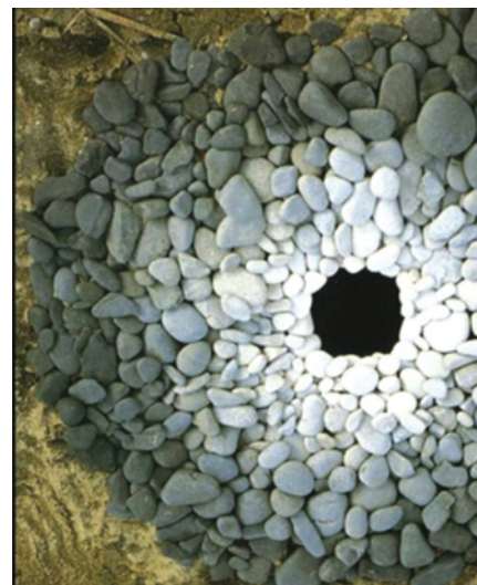
ایجاد حلقه با استفاده از سایه روشن سنگ، اندی گلندورثی، هامفری شایر، انگلستان، ۱۹۹۵

مقیاس، تناسب و جای‌گذاری با محیط مطابقت دارند.