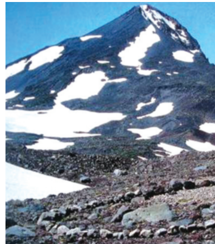
دایره سنگی، ریچارد لانگ، سوییس، ۱۹۹۳