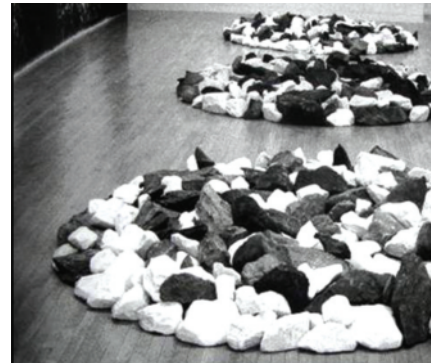
سه دایره، ریچارد لانگ، خیابان تامسون، شماره ۶۵ نیویورک، ۱۹۹۳