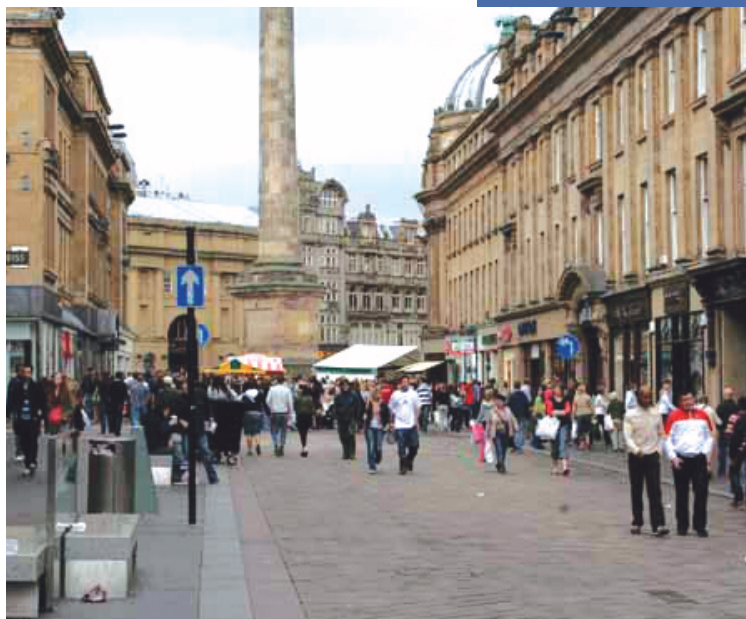
«فرش آبی»، فضای شهری طراحی شده برای مردم

تیرک‌های مانع ورود خودرو، به طرز هنرمندانه‌ای از کف سربرآورده و مصالح کفسازی را خم نموده‌اند (تصویر ۲). نیمکت‌های این فضای جمعی از تاخوردن و برگشتن نورهایی از کفسازی ایجاد شده است. در فضای خالی کنار نیمکت‌ها، لامپ‌های فلورسنت به منظور نورپردازی فضا، تعبیه شده‌است (تصویر ۳). مصالح کف به گونه‌ای انتخاب شده که این مکان، متمایز از سایر مکان‌ها و خیابان‌های همجوار باشد. در این پروژه پله‌ای گرد رابط میدان جدید به پیاده‌روی است که از شاهراه مرکزی عبور کرده و به پارکینگ بزرگ و مترو می‌رسد.