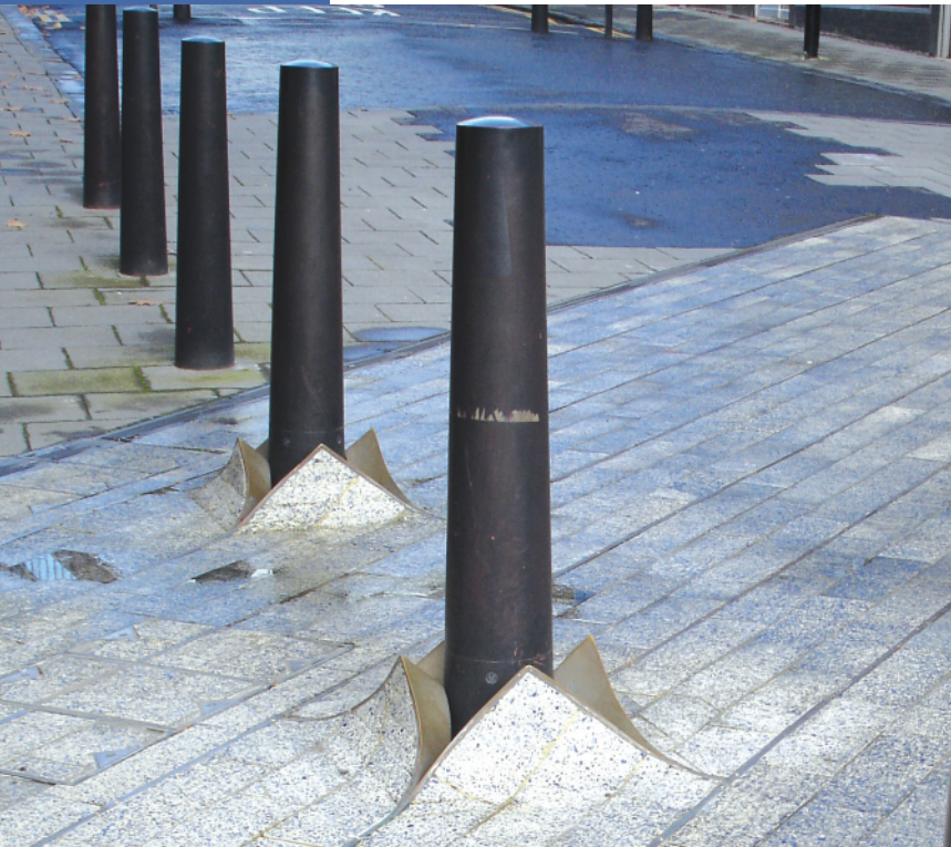
۲: رفتار منعطف کفسازی در برخورد با تیرک‌های مانع ورود خودرو

مشخصات پروژه ■ موقعیت: نیوکاسل، آبن تاین ■ تکمیل: سال ۲۰۰۲ ■ کارفرما: شهرداری نیوکاسل ■ تیم طراحی: معمار/طراح: توماس هیترویک ■ مسئول برنامه‌ریزی: شهرداری نیوکاسل ■ تأمین بودجه: مؤسسه هنری و بودجه توسعه منطقه‌ای اروپا ■ ارزش قرارداد: ۱,۴ میلیون پوند