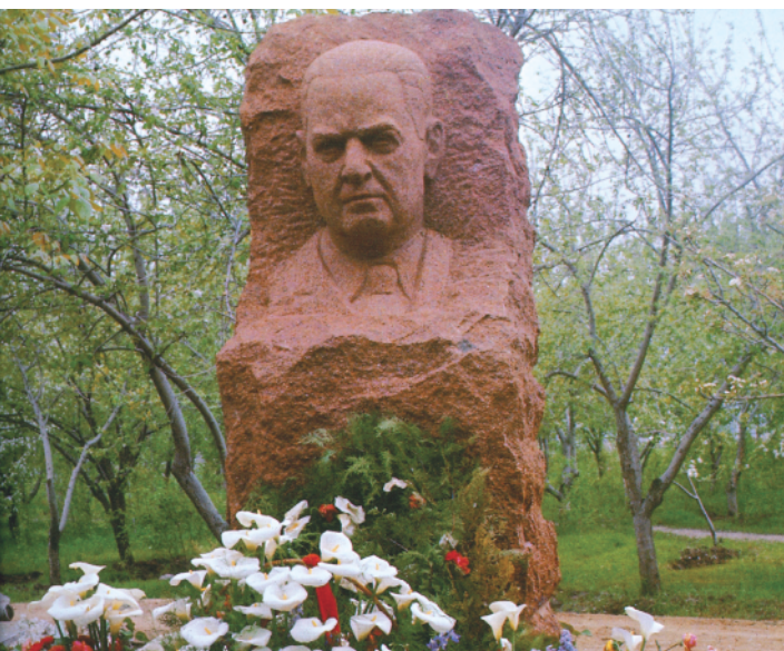
چهره متفکر و جدی «غفورفا» در قالب نیم تنه‌ای سنگی بر مزار این مؤلف و مورخ بزرگ دیده می‌شود. به کارگیری این شیوه از تندیس‌گری سنگی از شخصیت‌ها با شبیه‌سازی دقیق برای سنگ مزارها روشی معمول در هنر سوسیالیستی است. همچنین در گورستان‌های اروپا نیز این روش معمول است.

» هیکل «امیر تیمور» با تاج و شمشیر و شئل و با چهره‌ای آرام و متبسم اما مصمم و بسیار جدی و فاتحانه به دوردست می‌نگرد. چهره‌ای که از این فرمانروای مقتدر در تاریخ امروز تاجیکستان دیده می‌شود کاملاً متفاوت با تصویری است که در ایران از گذشته تاکنون شاهد آن بوده‌ایم. مرسوم است که عروس و داماد برای ادای احترام دسته گلی به پیشگاه هیکل امیر آورده و شاه محبوب و حامی خویش را می‌ستانند. میدان مرکزی شهر سبزی، مقابل آق‌سرای، ازبکستان