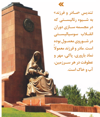
«تندیس «مادر و فرزند» به شیوه رئالیستی که در مجسمه‌سازی دوران انقلاب سوسیالیستی در شوروی معمول بوده است. مادر و فرزند معمولاً نماد باروری، پاک، مهر و عطف در هر سرزمین، آب و خاک است.