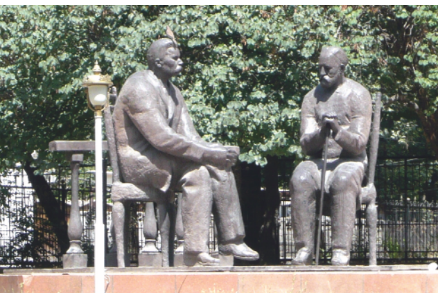
دیدار «ماکسیم گورکی» و «صدرالدین عینی»، گورکی نویسنده مشهور روسی و عینی ادیب زبردست که آثار او در کتب درسی، تدریس می‌شود؛ امروز جوانان و نوجوانان تاجیک اشعار او را از بر با لهجه شیرین تاجیکی می‌خوانند.