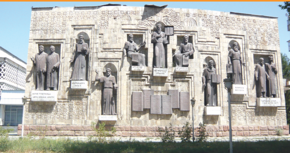
مجسمه‌های مشاهیر تاجیکستان از سمت راست: ماکسیم گورکی، صدرالدین عینی، حافظ شیرازی، سعدی شیرازی، ابوالقاسم فردوسی، ابوعبدالله رودکی، ابن سینا، عمر خیام، عبدالرحمان جامی، میرزا تورسن زاده، ابوالقاسم لاهوتی