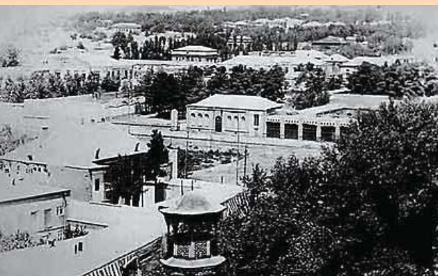
منظره عمومی شمال تهران، سال ۱۳۱۰

چیزی که طرح‌های جامع احتیاج دارند نظریه‌های کاربردی یا معطوف به کاربرد به اضافه روش‌شناسی‌های قابل دفاع به اضافه نماگرهای موثر است. این «نماگرها» چه هستند؟ البته اگر به سایت‌های کامپیوتری مراجعه و به جستجوی نماگرها برویم با خیل عظیم ۵/۷ میلیون وب سایت که به نماگرها اختصاص یافته‌اند، روبرو می‌شویم (این رقم امروز حتماً بیشتر شده است زیرا متعلق به سال ۲۰۰۵ بوده است). واضح است که انتخاب، تشخیص سلسله مراتب، اولویت‌بندی، طبقه‌بندی و استنتاج از آن‌ها تخصص می‌خواهد. این نماگرها سابقه‌ای میان یک تا صدسال دارند. استفاده از آن‌ها می‌تواند بی‌ثمر یا حتی