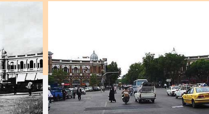
میدان حسن‌آباد، سال ۱۳۸۸

به نظر می‌رسد در بررسی و تدوین طرح‌های سه‌گانه جامع تهران، چیزی به نام روش‌شناسی و نظریه‌شناسی به کار نرفته‌است و آن‌چه بوده است جمع‌آوری اطلاعات رسمی و نه همیشه مطمئن و رسیدن به ارقامی بوده است که بر اساس آستانه‌های کاملاً فرضی و ذهنی تدوین شده است.