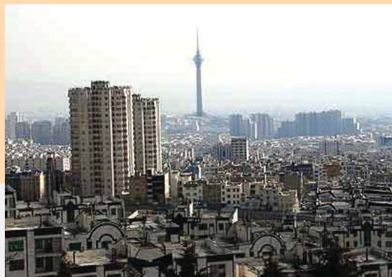
منظره عمومی شمال تهران، سال ۱۳۸۸