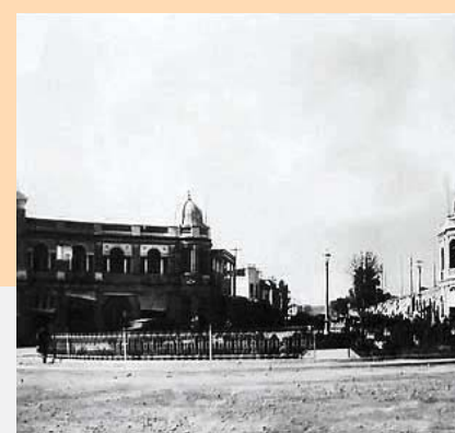
میدان حسن‌آباد، سال ۱۳۰۰