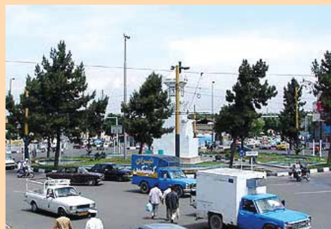
میدان شوش، سال ۱۳۸۸