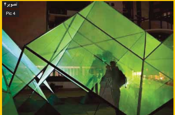
تصویر ۲ Pic 4

Pic4: Audience presence as an element in shaping the space, Melbourne, Australia.