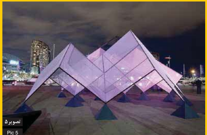
تصویر ۵ Pic 5