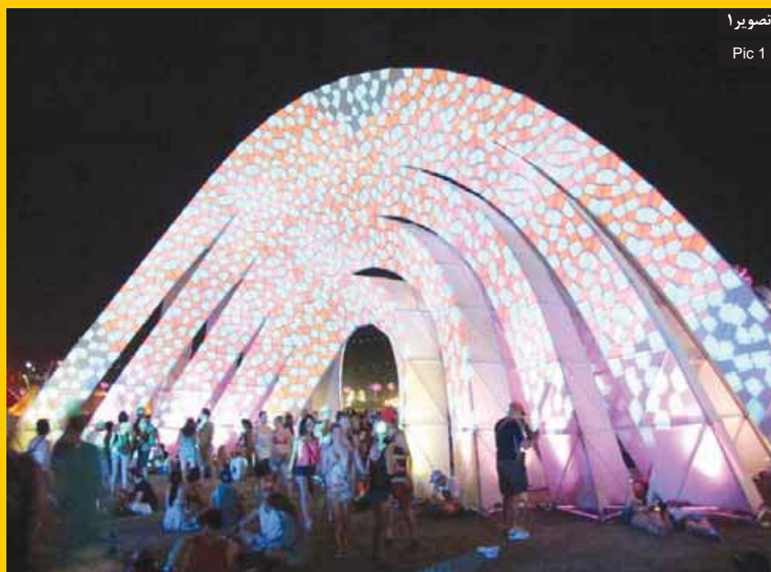
تصویر ۱ Pic 1

Pic1: Combining lighting with citizens' shadows creates a dynamic urban space, Indio, California.