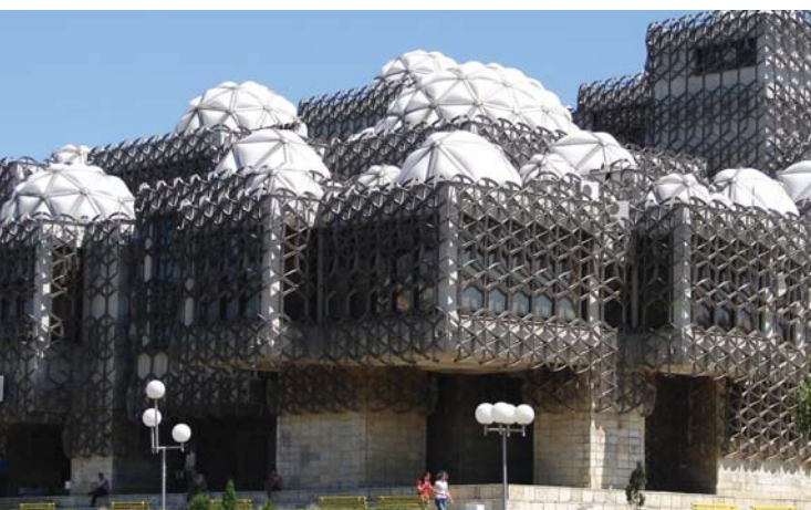
۹. کتابخانه ملی (پرستینا-کوزوو)