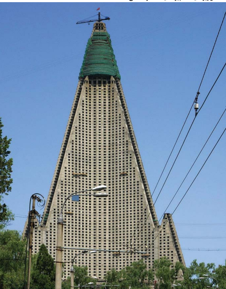
۱۰. هتل ریوگ یانگ (پیونگ یانگ-کره شمالی)

مؤسسه مجازی گردشگری «VirtualTourist»، برخی مشخصات خود را در سایت www.virtualtourist.com چنین معرفی کرده است: