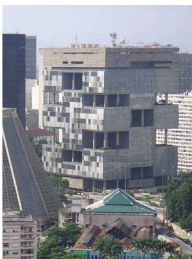
۶. ساختمان پتروبراس (ریودو ژانیرو-برزیل)