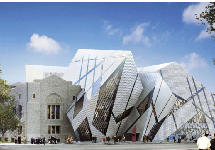
۸. موزه سلطنتی اونتاریو (تورنتو-کانادا)