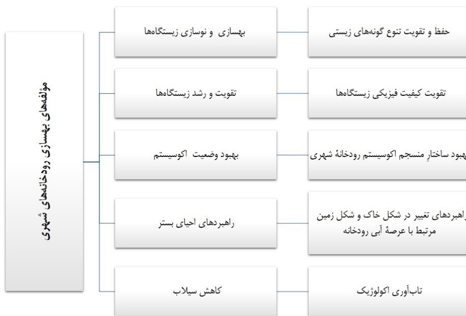
تصویر ۲. مؤلفه‌های بهسازی رودخانه‌های شهری.

بهسازی رودخانه‌ها راهبرد کلیدی برای بهبود کیفیت محیط و تنوع زیستی در دهه‌های اخیر با تأکید روزافزون بر ارزش عملکرد رودخانه‌ها و خدمات اکوسیستم ارائه شده توسط آبراهه‌ها، علاقه به بهسازی رودخانه به‌طور قابل‌توجهی افزایش یافته است (Lemons & Victor, 2008). در حقیقت اصطلاح بهسازی رودخانه ۱۷ به توانبخشی و نوسازی گونه‌های زیستی، تقویت و رشد زیستگاه‌ها، بهبود وضعیت اکوسیستم رودخانه، راهبردهای بهسازی، راهبردهای باززنده‌سازی بستر و احیا مجدد ۱۸ و کاهش سیلاب اشاره دارد (تصویر ۲) (Beechie & Roni, 2012). در مطالعات مثنوی و همکاران (Masnavi, Tasa, Ghobadi, Farzad Behtash & Negin Taj, 2016) بهسازی رودخانه‌های شهری متأثر از چهار فاکتور اصلی: زیست‌محیطی، فضای شهری، فرهنگی-اجتماعی، سیاسی