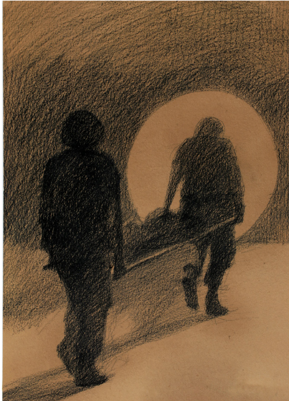
تصویر ۴: طراحی نمادین و معناگرا از دو رزمنده‌ای در حمل پیکر شهید.

به دنبال ترکیب‌بندی‌های ویژه در سال‌های بعد، در مجموعه آثاری با موضوع جنگ و حواشی آن مربوط به سال ۱۳۶۷ ه.ش. هنرمند به ترکیب‌بندی آثار و بهره‌گیری از خطوط شکسته در تکمیل ترکیب‌بندی‌های کلاسیک همت گماشته است. در این مجموعه که بعضاً با