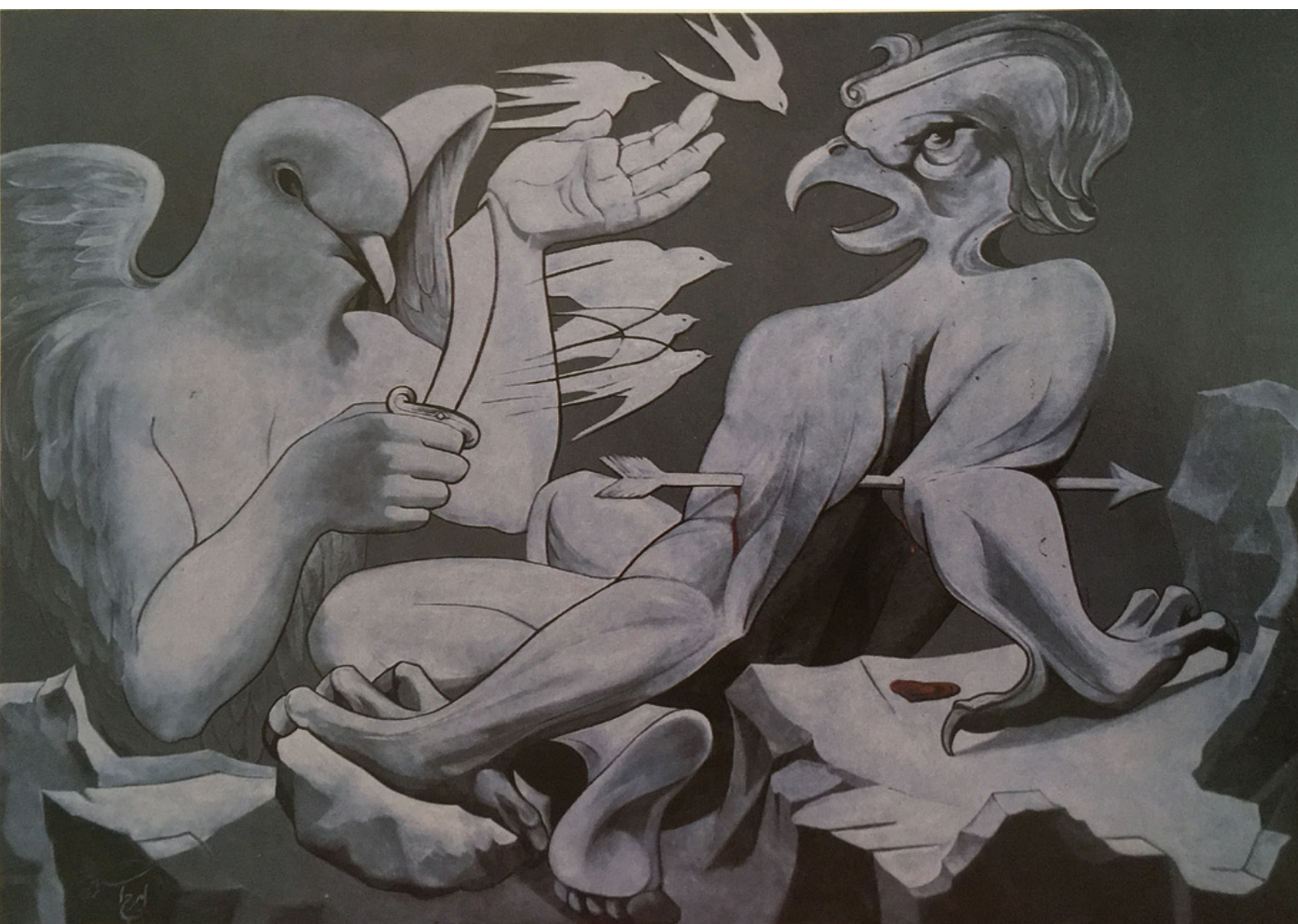
تصویر ۱۱: بیان احساس نقاش از جنگ و تقابل خیر و شر در قالب دو نماد پرنده.

در مجموعه آثار به نمایش درآمده در حوزه نقاشی‌های دیواری که از سال‌های نخستین انقلاب آغاز شده، هنرمند با بهره‌گیری از تجربیاتش در نقاشی در عرصه ترکیب‌بندی‌های