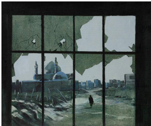
تصویر ۹: اثری با موضوع خرابی‌های خرمشهر.