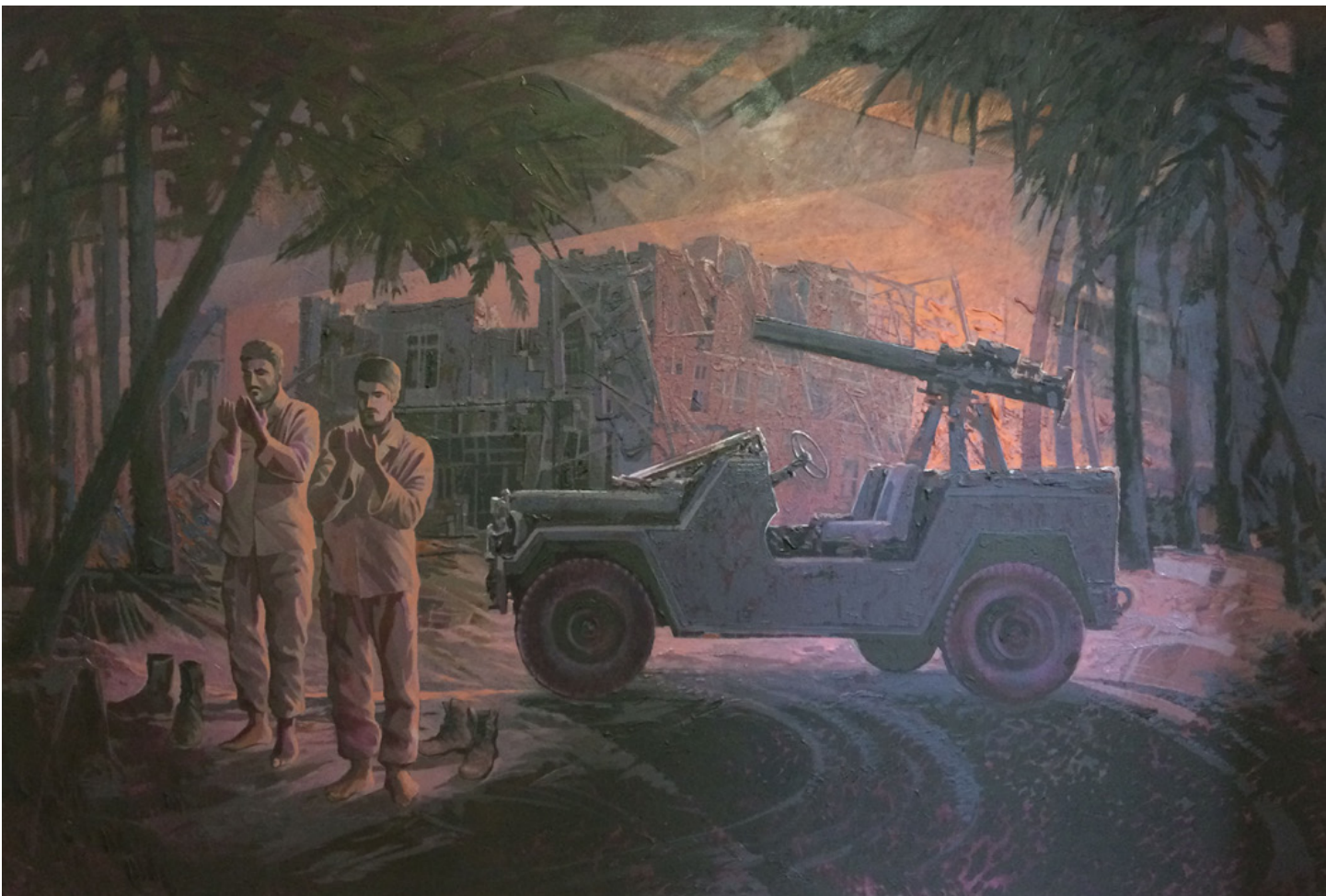
تصویر ۷: صحنه‌ای از دو رزمنده در منطقه جنگی که معرف منطقه و اعتقاد آنان بوده.

در ادامه، نقاش به نمایش مجموعه‌ای از آثار پرداخت که بیشتر به بیان احساسات او از وقایع جنگ و مفاهیم مربوط به آن بابیانی استعاری و نمادگرایانه می‌پردازد؛ وقایعی که در بازه‌های زمانی هنرمند را تحت تأثیر قرار داده و ایرج