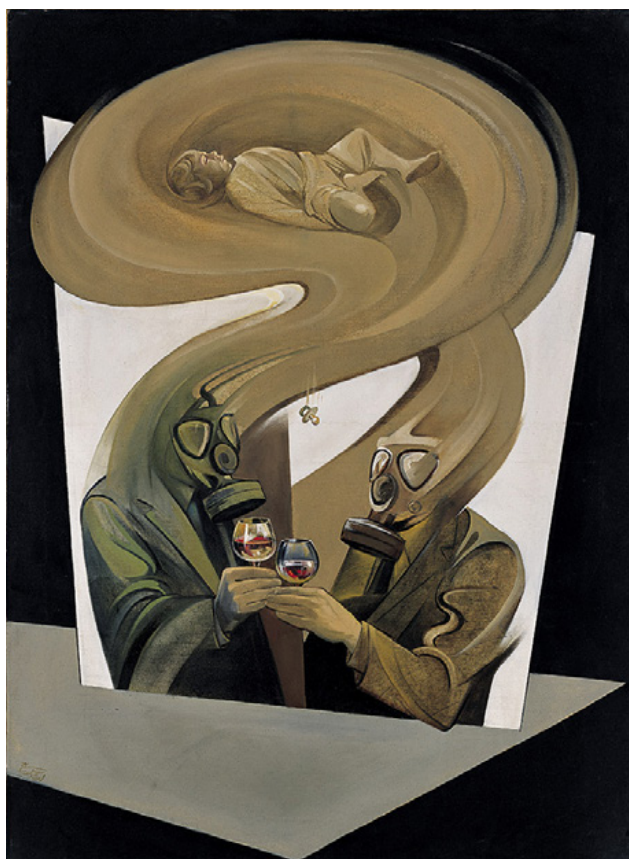
تصویر ۸: اثری با موضوع حمله‌ی شیمیایی به حلبچه.

در مجموعه دیگری از آثار، نقش نمادها و نشانه‌ها بسیار قوی است. نمادهایی چون پرنده سفید، ماهی قرمز، کوه دماوند و... در این مجموعه آثار دیده می‌شود. از جمله در تابلویی که در آن رزمنده‌ای با سر بند سبز در پیش‌زمینه به قله دماوند و مسجد و روستایی در دامنه‌اش در پس‌زمینه چشم دوخته است. در اثری دیگر، نقاش با گرتهداری از کارهای پیکاسو با