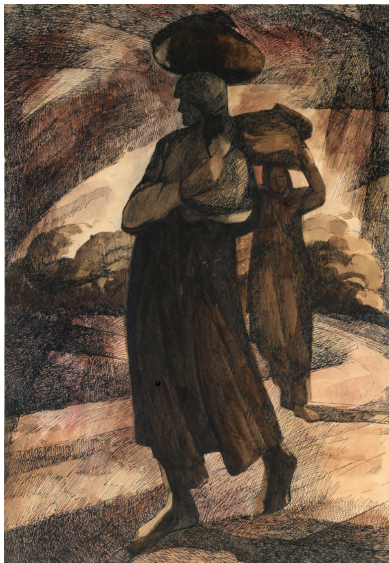
تصویر ۵: بهره‌گیری از خطوط و ترکیب‌بندی در بیان جنگ و مفاهیم مرتبط با آن. نقاشی نمادین از کوچ و آوارگی.