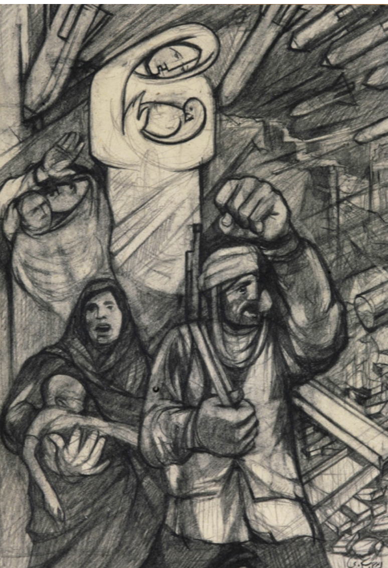
تصویر ۶: اثری بانام «مقاومت»؛ بهره‌گیری از ترکیب‌بندی در بیان مفهوم خشن جنگ و حضور امید به صلح.

در ادامه نقاش با نمایش آثاری چندمیزان تأکید بر ترکیب‌بندی در نقاشی‌های این دوره از فعالیتش را نشان می‌دهد، از جمله آثاری از مقاومت و صحنه‌هایی از داخل جنگ در اثری بانام «مقاومت» که در آن ساختار محکم کار بیانگر فضای جنگ است و در پس‌زمینه موشک‌های در حال هجوم به صورت فلش نمایش داده‌شده که بیانگر هیجانات ضمن جنگ است. علاوه بر این در سفیدی پس‌زمینه، زنی پرنده‌ای را در بغل گرفته که حالت نمادین به اثر داده است (تصویر ۶).