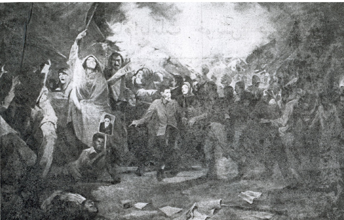
تصویر ۲: نقاشی با موضوع ۱۷ شهریور.