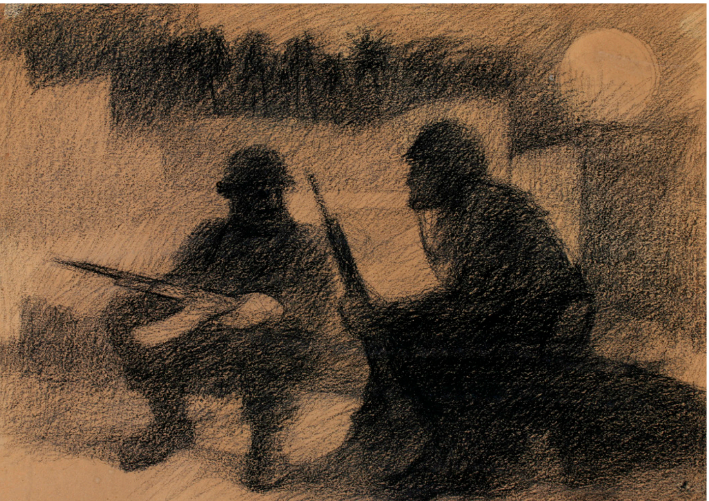
تصویر ۳: طراحی ساختارگرا و تصویر دو رزمنده در حال گفتگو.

در این مجموعه آثار نقاش در بعضی جاها به سمت بیان مفهومی و استعاره‌ای از وقایع حرکت کرده است. در این گروه از طراحی‌ها معانی و نمادهایی از جنگ حضور دارند [که یا از ذهنیت هنری نقاش سرچشمه گرفته و یا در اذهان و مناظر آن زمان وجود داشته که به شکل نماد درآمده است]؛ مانند تصویر دو رزمنده‌ای که پیکر شهید را حمل می‌نمایند که