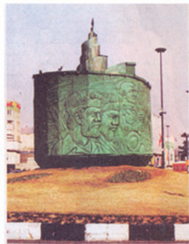
تصویر ۱۲: اثری برای نقاشی دیواری که در میدان انقلاب به صورت ماکت اجرا شده است.