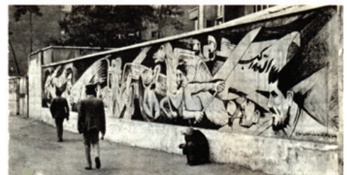
تصویر ۱۳: اثر نقاشی دیواری در خیابان انقلاب؛ نمادی از تقابل ظالم و مظلوم.