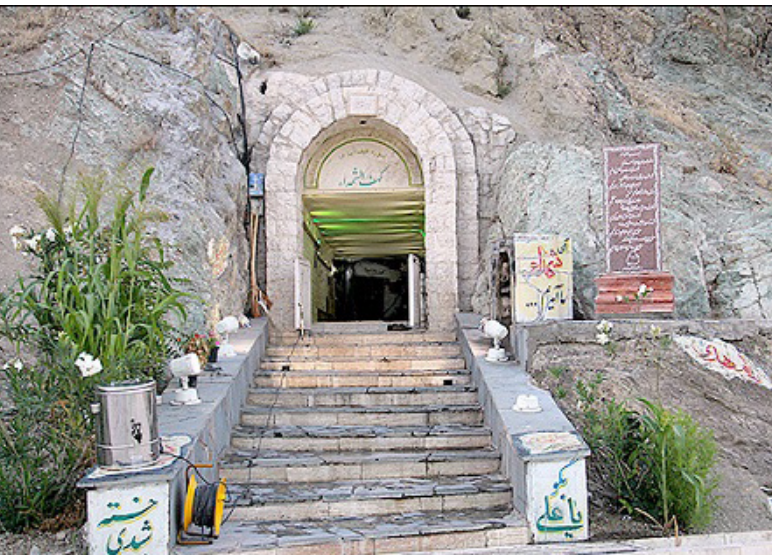
تصویر ۱۱: مزار شهدای گمنام کوه شهدا ولنجک.

مزار شهدای گمنام کوه شهدا بالای کوهی در شمالی‌ترین نقطه تهران، در منطقه ولنجک، قرار دارد که در تاریخ ۱۳۸۶/۳/۲۸ تعداد پنج از تن از شهدای گمنام در این مکان به خاک سپرده شده‌اند. مسافت حدود ۵۰۰ متری دامنه را تا مزار شهدا در جاده‌ای خاکی (بدون طرحی از پیش تعیین شده برای محوطه مزار (باید طی