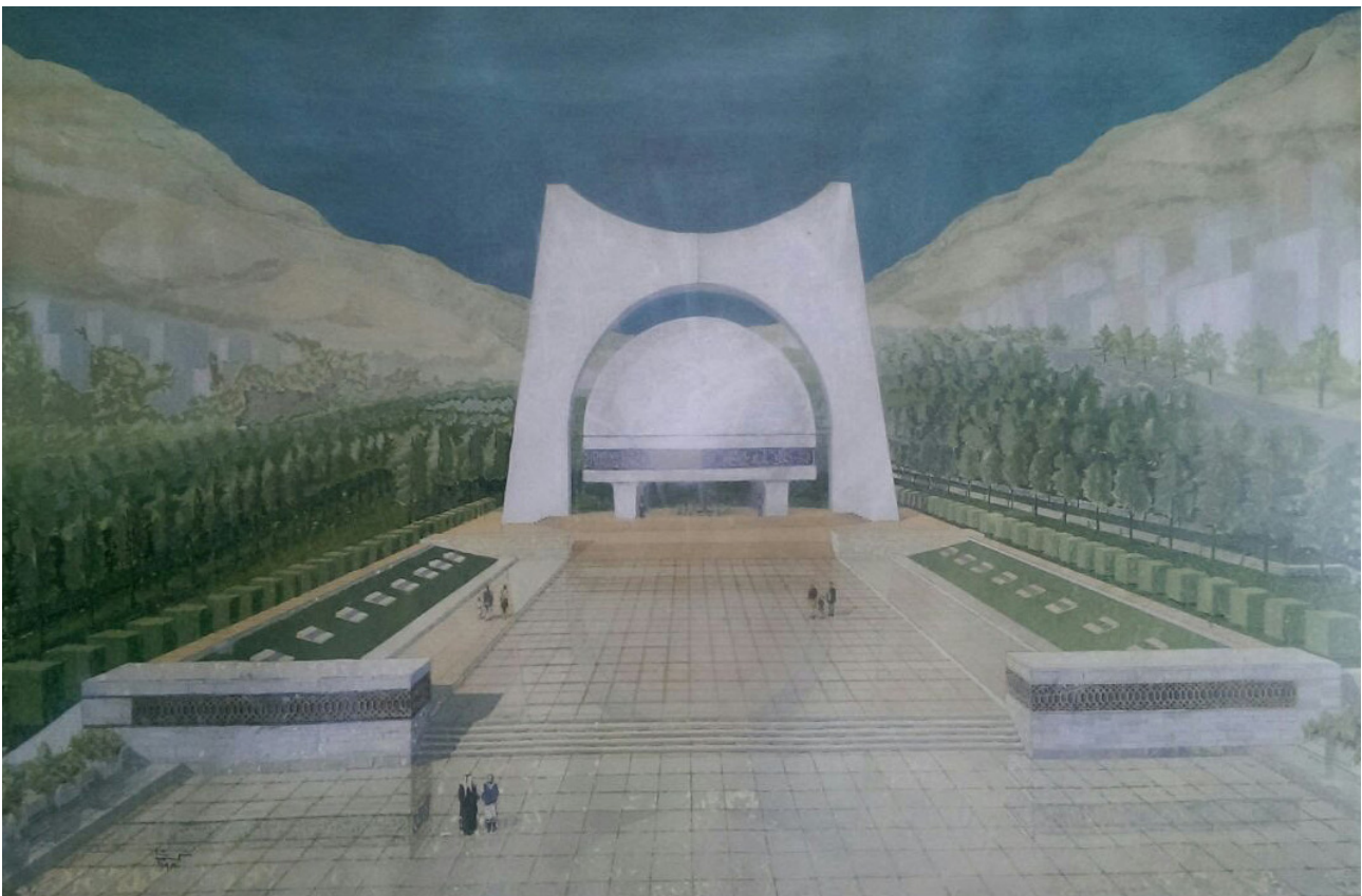
تصویر ۱: یادمان سرباز گمنام سوری - دمشق - سوریه.

فضای جمعی دربردارنده نمادهایی است که عامل تداوم و ارزش‌های جمعی و مدنی مردم و حاوی میراث فرهنگی و تاریخی جامعه است و از این‌روست که فضای شهری به‌واسطه این محتوا مرکز نمادین پایداری ارزش‌های مردمی است که به بیان قدرت خویش می‌پردازند و آن را در فضا متبلور می‌سازند. فضای جمعی مکانی است مناسب برای جاری شدن