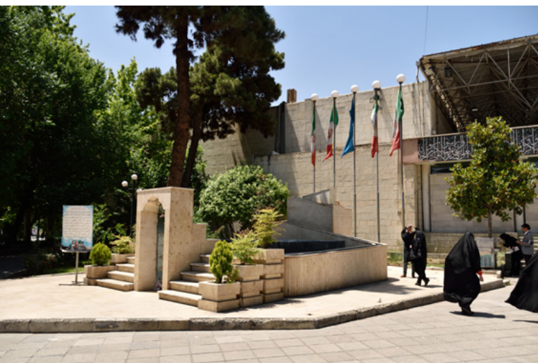
تصویر ۸: مزار شهدای گمنام در کنار ورودی مسجد دانشگاه تهران. عکس: حسین پروین، ۱۳۹۵.

مزار و یادمان شهدای گمنام دانشگاه تهران - انتخاب سایت به‌منظور تدفین شهدای گمنام در دهه اخیر به سمت مراکز دانشگاهی، سوق پیدا کرده است. از این دست می‌توان به ایجاد مزاری ساده بدون طراحی سایت برای پنج شهید گمنام در کنار ورودی مسجد دانشگاه تهران (تصویر ۸) و یادمان شهدای دانشگاه، به صورت فرم خالص به‌دوراز تجمل، در باغ پشت مسجد اشاره کرد (تصویر ۹). در این مورد آخر با طراحی ویژه و فکر شده منظر سایت، به‌تدریج به