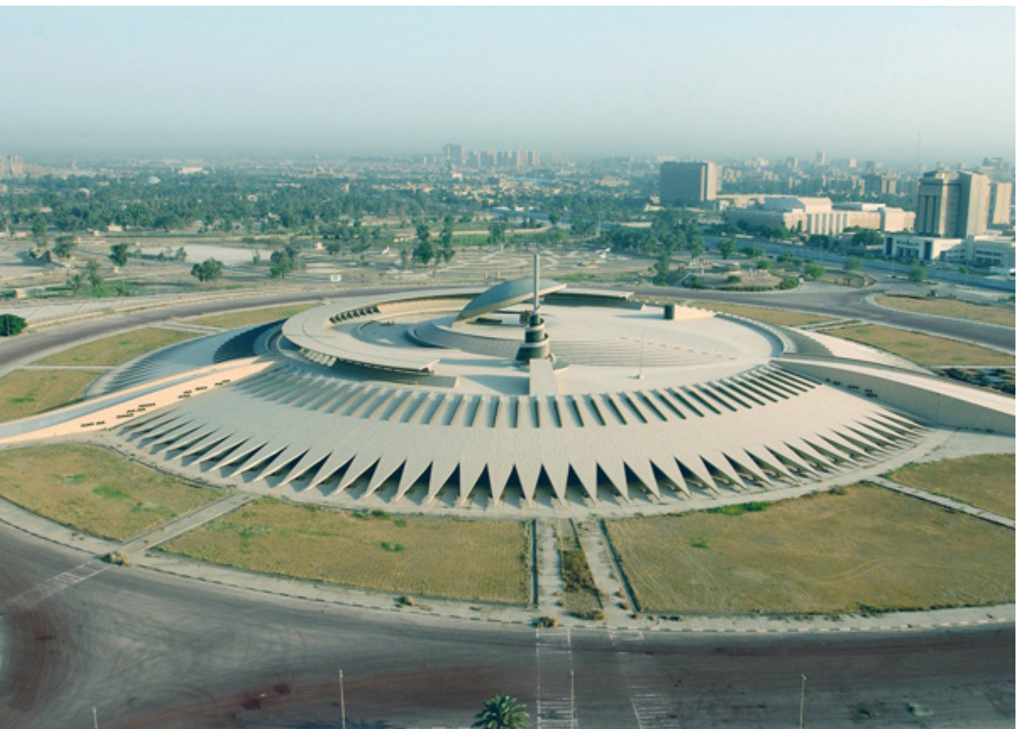
تصویر ۳: یادمان سرباز گمنام، بغداد، عراق.

حفظ می‌کند. بستر یادمان را، آن‌چنان که مشاهده می‌گردد، صفه مصنوعی، به فرم مخروط ناقص، کم ارتفاع و به قطر ۳۵۰ متر شکل می‌دهد که موزه را در دل خویش مدفون دارد. این مخروط به وسیله شاه‌تیرهای مثلثی شکل مورب احاطه شده است که پوششی از مرمر دارند. صفه بیضوی شکل مطابق از گرانیب قرمز، زمینه‌ی قرارگیری گنبد (سپر) و مکعب را شکل می‌دهد (www.architect.com). به کارگیری صفه به منظور تأکید بصری بر فرم یادمانی است که در یادمان‌های حکومتی- اشرافی از دیرباز معمول بوده است. سنگینی بصری فرم بکار گرفته شده و نظام هندسی متقارن و مرکزی‌اش از دیگر خصوصیات این دسته از یادمان‌هاست (تصاویر ۳ تا ۵).