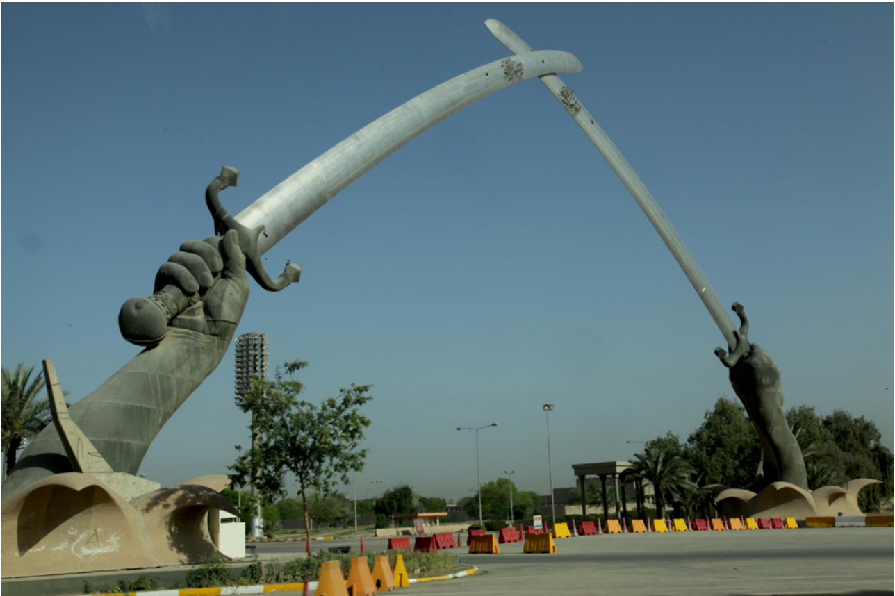
تصویر ۲: یادمان دست‌های پیروز - بغداد.