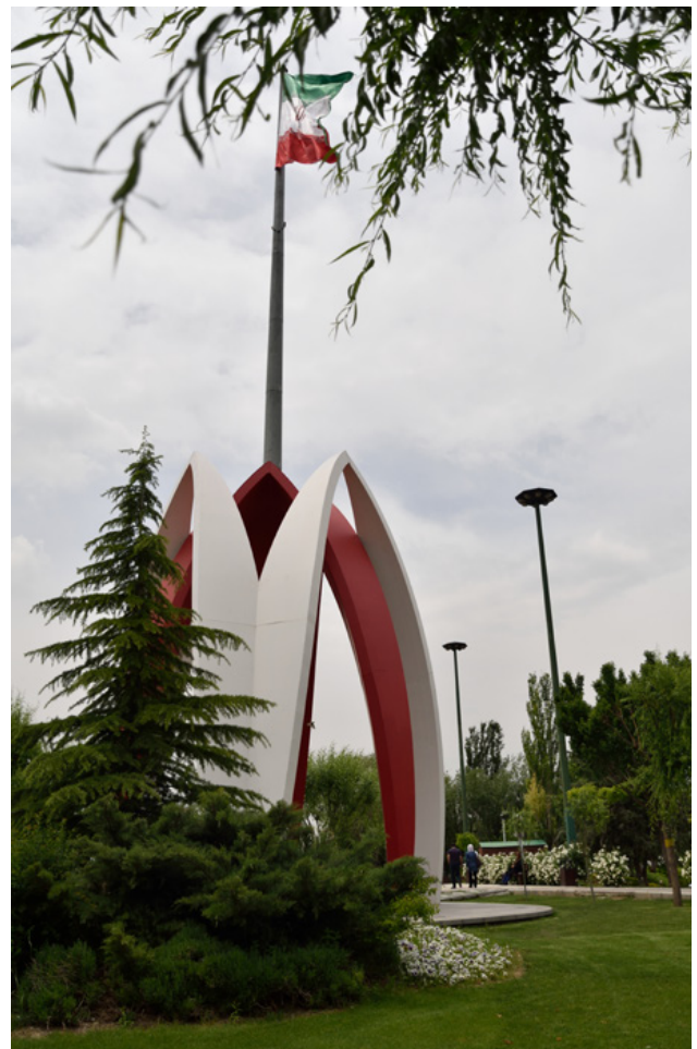
تصویر ۱۳: مزار و یادمان شهدای گمنام بوستان پرواز. عکس: حسین پروین، ۱۳۹۵.