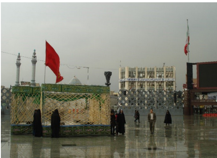
تصویر ۱۰: یادمان شهدای گمنام میدان امام حسین (ع).