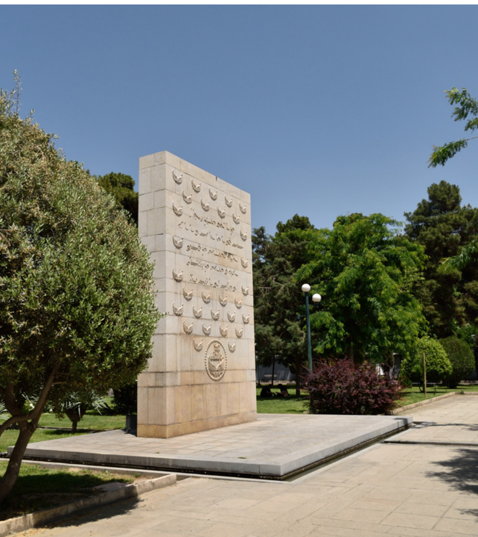
تصویر ۹: یادمان شهدای دانشگاه تهران، در باغ دانشگاه.

مزار و یادمان شهدای گمنام دانشگاه تهران - انتخاب سایت به‌منظور تدفین شهدای گمنام در دهه اخیر به سمت مراکز دانشگاهی، سوق پیدا کرده است. از این دست می‌توان به ایجاد مزاری ساده بدون طراحی سایت برای پنج شهید گمنام در کنار ورودی مسجد دانشگاه تهران (تصویر ۸) و یادمان شهدای دانشگاه، به صورت فرم خالص به‌دوراز تجمل، در باغ پشت مسجد اشاره کرد (تصویر ۹). در این مورد آخر با طراحی ویژه و فکر شده منظر سایت، به‌تدریج به