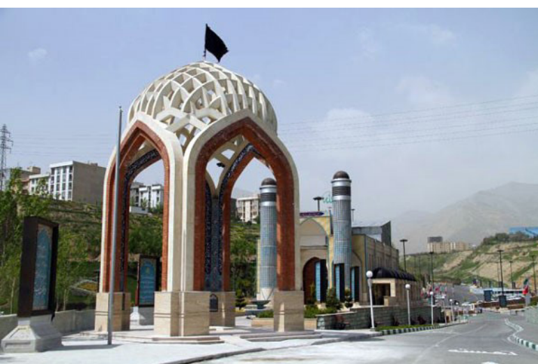
تصویر ۱۲: مزار و یادمان شهدای گمنام بوستان نهج‌البلاغه.