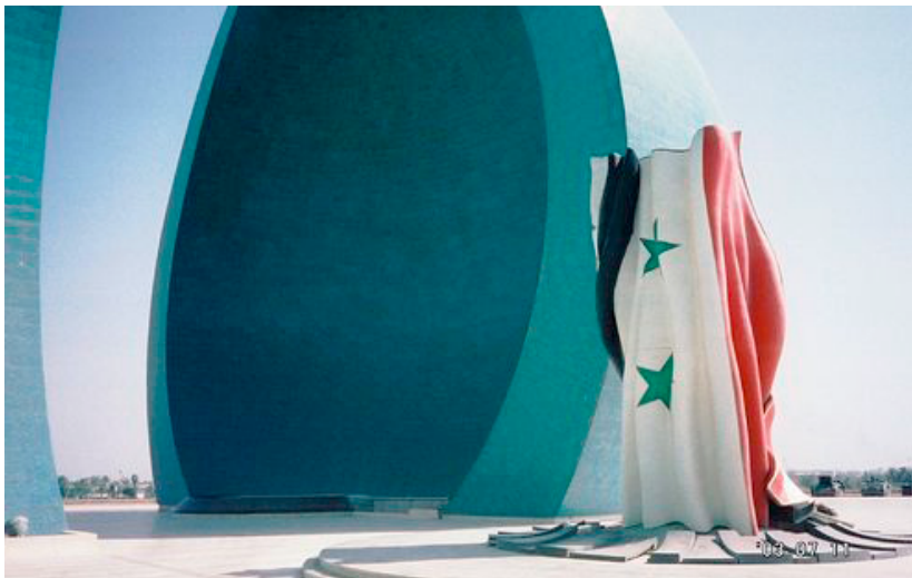
تصویر ۷ : یادمان الشہید، پرچم عراق در زیر گنبد.