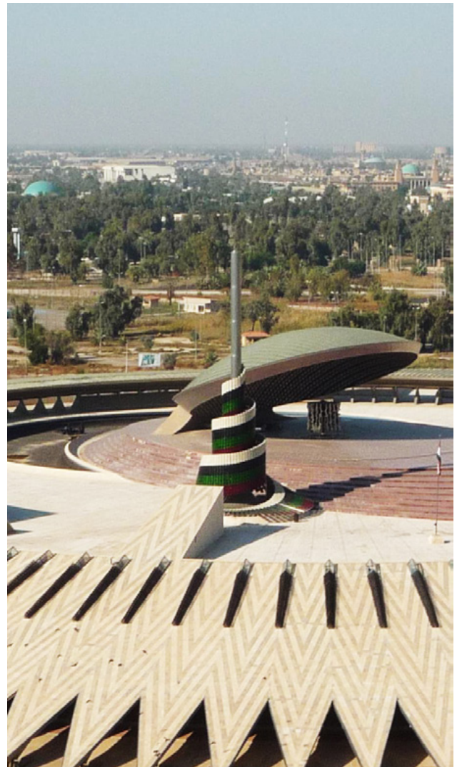
تصویر ۵ : یادمان سرباز گمنام عراقی، بغداد، عراق.

این یادمان به سربازان عراقی که در جنگ ایران و عراق کشته شده‌اند، اختصاص داده شده است. این یادمان شامل صغه دایره‌ای شکل به قطر ۱۹۰ متر است. در میانه یک دریاچه مصنوعی، بر روی صغه یک گنبد بیضوی با قطر ۴۰ متر قرار گرفته است که مانند گنبدهای دوران عباسی بوده و با کاشی‌های فیروزه‌ای پوشیده شده است. این گنبد به دو قسمت تقسیم شده که استعاره‌ای از شهدای تکه‌تکه شده عراقی در جنگ ایران و عراق است (تصویر ۶). در میانه این دو گنبد مجسمه‌ای به صورت پرچم عراق قرار داده شده است (تصویر ۷). به کارگیری موتیف‌های وطن پرستانه شناخته شده برای عوام همچون پرچم، در یادمان‌های شکل گرفته در حکومت‌های دیکتاتوری که در صدد جلب نظر عامه مردم هستند، بسیار مرسوم است. فضای زیرین صغه مصنوعی در دو طبقه شامل کاربری‌هایی همچون موزه، کتابخانه، کافه تریا، اتاق سخنرانی، گالری‌ها و فضاهای پشتیبانی است (www.archnet.org).