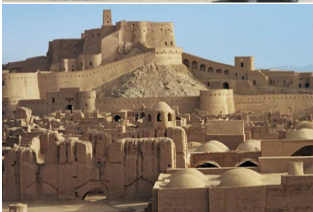
تصویر ۵. تشابه سازه‌های خشتی در ایران و عمان؛ بالا: قلعه بهلاء. مأخذ: آرشیو نگارندگان و پایین: ارگ بم. مأخذ: www.caio.ir

بسیار در سیما و منظر هر دو کشور شده است و افراد هر دو فرهنگ در مواجهه با ساختمان‌های خشتی، احساس نزدیکی به هم دارند. از این نمونه‌ها می‌توان به ساختمان‌های دفاعی خشتی چون ارگ بم در ایران و قلعه‌های نزوا و بهلاء ۱۵ در عمان اشاره کرد (تصویر ۵). از سویی در معماری معاصر عمان نیز می‌توان الگوهایی مشاهده کرد که با ارجاع به تاریخ و فرهنگ همگام با به‌روزرسانی ساختارهای اصیل هستند. برای مثال در بسیاری از آثار معاصر کشور عمان، اصولی چون محوریت، تقارن و تأکید بر امتدادهای مستقیم و عناصری چون گنبد مشاهده می‌شود که نه تنها در فرم سه‌بعدی ساختمان‌ها نمایان است، بلکه در نمای ساختمان‌های شهری و استانداردهای شهرسازی نیز رعایت می‌شود. ساختمان دادگاه عالی عمان (تصویر ۶) یکی از ساختمان‌های مهم و دولتی است که این ویژگی‌ها کاملاً در آن قابل رؤیت هستند. تصویر ۷ نیز یکی از ورودی‌های فرعی بازار در شهر مطرح را نشان می‌دهد. این سبک از معماری الهام گرفته از معماری سنتی کشور عمان است که مشابه آن در ایران نیز یافت می‌شود. بسیاری از عوامل دیگر مانند حضور نمادین آب و الگوی بازشوها مؤلفه‌های هستند که در معماری هر دو سرزمین دیده می‌شوند و می‌توان در مشابهت‌ها از آنها یاد کرد.