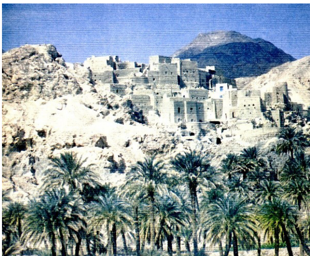
تصویر ۲. بافت روستای نای‌بند در ایران.