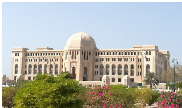
تصویر ۶. ساختمان دادگاه عالی عمان در مسقط.