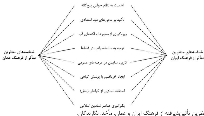
تصویر ۸. شناسه‌های مشترک منظرین تأثیرپذیرفته از فرهنگ ایران و عمان.