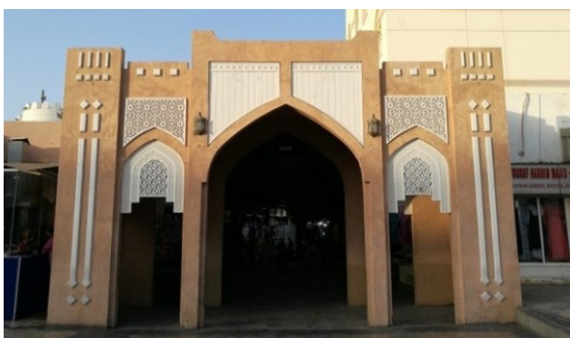
تصویر ۷. ورودی فرعی بازار مطرح-عمان.

بسیار در سیما و منظر هر دو کشور شده است و افراد هر دو فرهنگ در مواجهه با ساختمان‌های خشتی، احساس نزدیکی به هم دارند. از این نمونه‌ها می‌توان به ساختمان‌های دفاعی خشتی چون ارگ بم در ایران و قلعه‌های نزوا و بهلاء ۱۵ در عمان اشاره کرد (تصویر ۵). از سویی در معماری معاصر عمان نیز می‌توان الگوهایی مشاهده کرد که با ارجاع به تاریخ و فرهنگ همگام با به‌روزرسانی ساختارهای اصیل هستند. برای مثال در بسیاری از آثار معاصر کشور عمان، اصولی چون محوریت، تقارن و تأکید بر امتدادهای مستقیم و عناصری چون گنبد مشاهده می‌شود که نه تنها در فرم سه‌بعدی ساختمان‌ها نمایان است، بلکه در نمای ساختمان‌های شهری و استانداردهای شهرسازی نیز رعایت می‌شود. ساختمان دادگاه عالی عمان (تصویر ۶) یکی از ساختمان‌های مهم و دولتی است که این ویژگی‌ها کاملاً در آن قابل رؤیت هستند. تصویر ۷ نیز یکی از ورودی‌های فرعی بازار در شهر مطرح را نشان می‌دهد. این سبک از معماری الهام گرفته از معماری سنتی کشور عمان است که مشابه آن در ایران نیز یافت می‌شود. بسیاری از عوامل دیگر مانند حضور نمادین آب و الگوی بازشوها مؤلفه‌های هستند که در معماری هر دو سرزمین دیده می‌شوند و می‌توان در مشابهت‌ها از آنها یاد کرد.