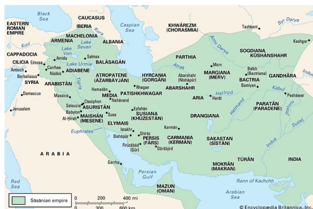
تصویر ۱. دولت ساسانیان (۲۲۴ تا ۶۵۱ بعد از میلاد) - نقشه مربوط به دوره شاپور اول.

خاطرات ارزش‌های هویتی جوامع در عناصر معماری آنها قابل شناسایی هستند (مانند گویش محلی، داستان‌های مشترک، آداب و رسوم واحد و ...).