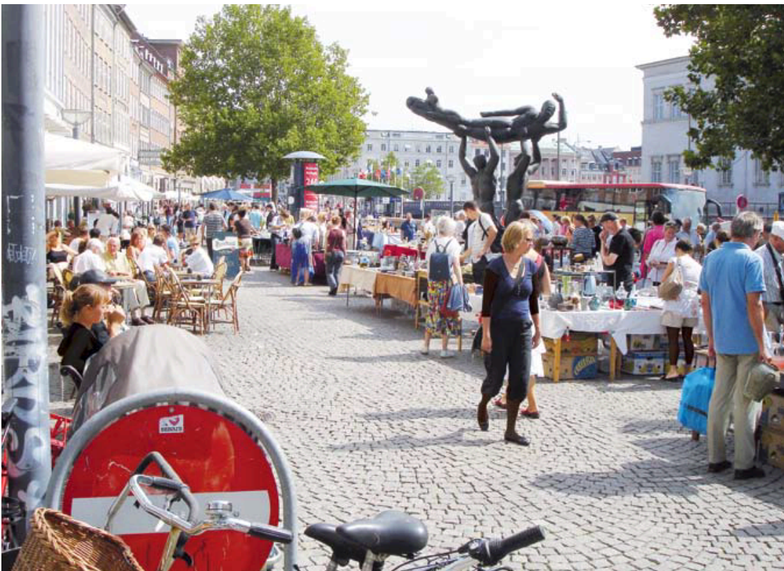
تصویر ۲: بخشی از محور پیاده قدیمی در ۱۹۳۵ جایی که ترافیک انواع وسایل نقلیه شروع به افزایش می‌کند. عکس: کیومرث حبیبی، ۱۳۸۷.