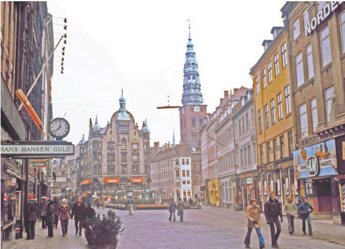
تصویر ۱: موقعیت پیاده‌راه استروگت در بافت کهن شهر کپنهاگ و عناصر تاریخی - فرهنگی زمینه‌ساز. عکس: کیومرث حبیبی، ۱۳۸۷.