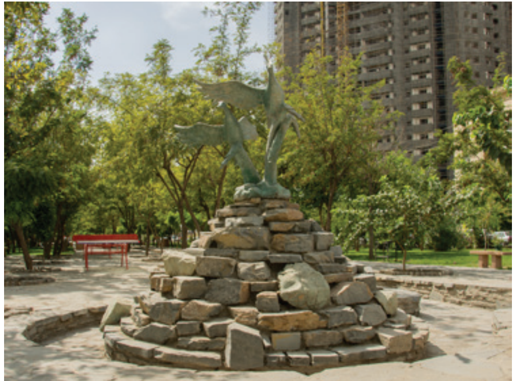
تصویر ۶ Pic6

عملاً استفاده کننده مجبور به تکرار یک مسیر به صورت رفت و برگشت می شود بدون اینکه امکان دسترسی به سطح و تراسی دیگر را بیابد (تصویر ۵). ۳- در مقیاس خردتر بوستان جوانمردان به همان اغتشاش بصری دچار است که سایر بوستان های شهری تهران به آن مبتلایند. اغتشاشی که حاصل تنوع و تعدد مبلمان نصب شده در بوستان های شهری است. در اینجا نیز نخستین چیزی که به چشم می آید تنوع آبخوری ها، آلاچیق ها، سطل ها، نیمکت ها، مجسمه های تزئینی و جانمایی بی برنامه و بی کیفیت این المان ها است که کیفیت بصری را تحت تأثیر قرار داده و اغتشاش بصری پروژه را موجب می شود (تصویر ۶).