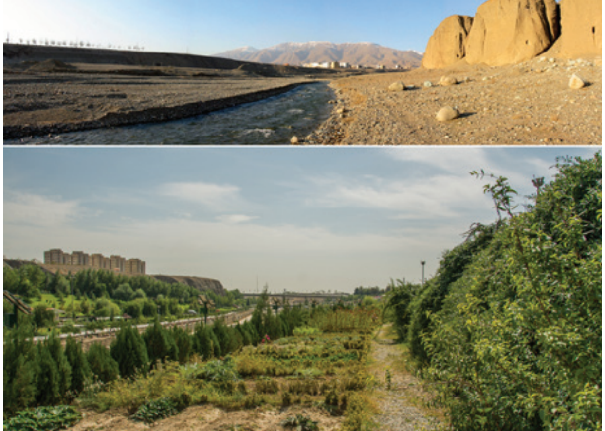
تصویر ۳ Pic3

ایجاد نموده و موجب شده تا طرح نهایی در پاسخ‌گویی به سیاست‌ها و اهداف اولیه که در مرحله برنامه‌ریزی مورد توجه کارفرما بوده است ناتوان بماند: