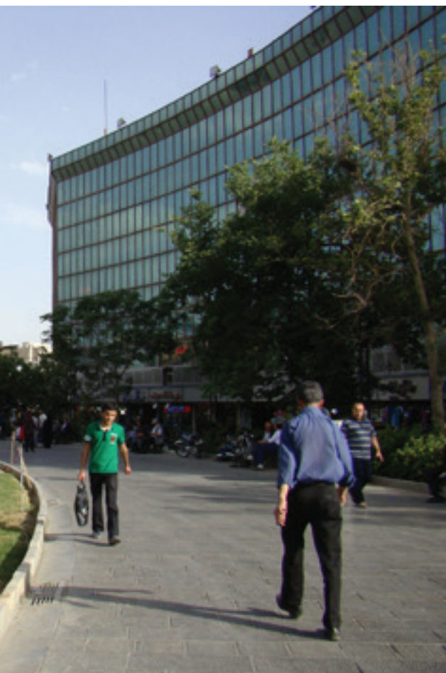
تصویر ۸: عدم تناسب مقیاسی و گونه گیاهان استفاده شده در طرح کاشت. عکس: فهیمه فرنوش، ۱۳۹۴.