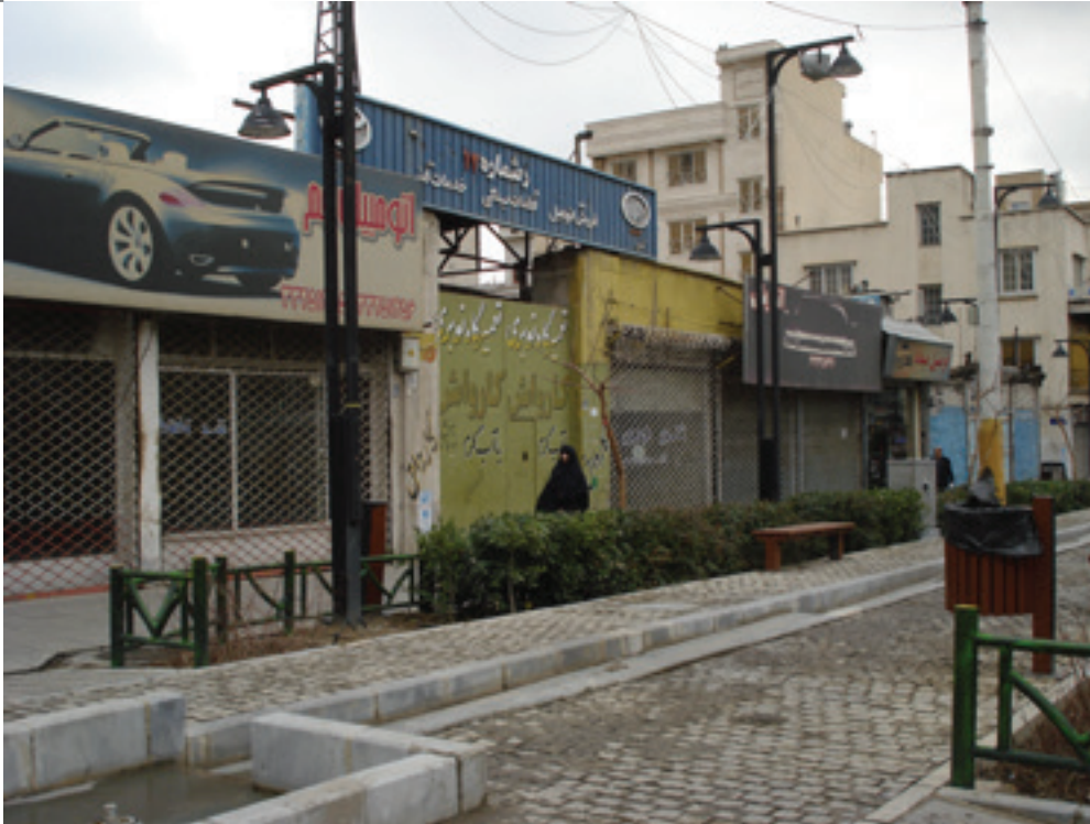
تصویر ۴: تعطیلی واحدهای تجاری به دلیل مداخلات بدون پشتوانه برنامه‌ای و جذب مشارکت مردم.

Pic4: The closure of commercial units due to the intervention without the program support and attraction of public participation.