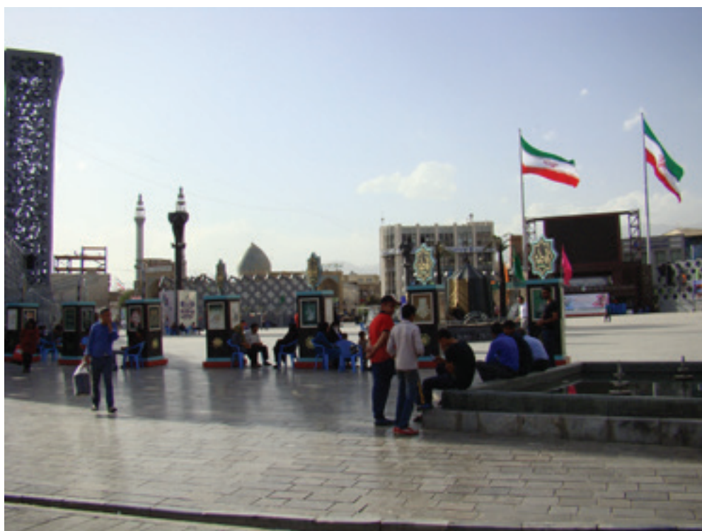
تصویر ۸ Pic8

design, implementation and feedback. Environmental intervention could not be the result of thought and values of a small crowd of programmers, designers or administrators, but it is necessary to form based on a transparent, reasonable, rational and participatory process. The relationship between man and man-made urban-environment space is a civil relationship in which the quality shapes the audience behavior patterns. Improving quality, creating a reasonable balance between the different roles of urban areas and focusing on the role of civil society ensures the survival of this relationship. The impact of management factor on the process of implementing a project should never be ignored. In the process of improving the quality of place, going out of daily decisions, and taste-based policies environment which will reversely lead to the reduction of qualitative values; Strategic