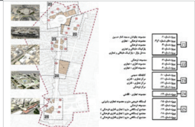
تصویر ۶ Pic6

Pic6: The vegetation of -17Shahrivar Street.