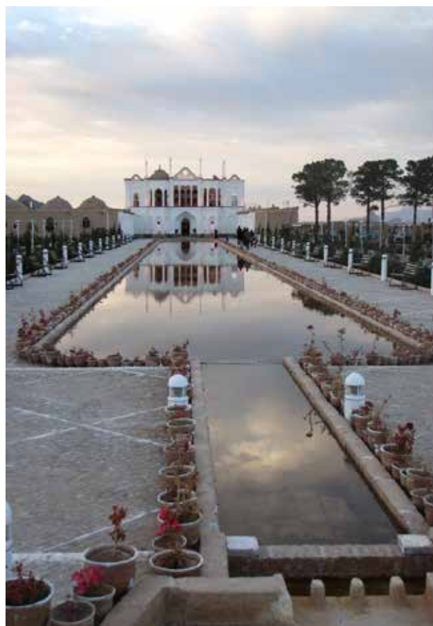
تصویر ۶. کوشک اصلی باغ فتح‌آباد در انتهای محور اصلی باغ.

میان اصلی‌ترین پیوندها، باغ فتح‌آباد به باغ ایرانی با توجه به شاخص‌های اصالت‌بخش به باغ ایرانی، که در بخش ساختار باغ ایرانی این نوشتار به‌عنوان مبانی نظری شناخت و خوانش باغ فتح‌آباد مورد اشاره قرار گرفت، محور اصلی باغ است که میان ورودی و کوشک اصلی کشیده شده است. همین‌طور محصوریت و دیوار جداکننده باغ از محیط اطراف و باغ‌های درونی از یکدیگر نقش مهمی در خوانش باغ به‌صورت سه باغ منفک و برقراری ارتباط با باغ ایرانی دارد. در مستندات مربوط به باغ فتح‌آباد قبل از مرمت، حضور ورودی و دیوارهای جداکننده به خوانش خیابان اصلی به سمت کوشک اصلی کمک می‌کند. در مرمت باغ جایگزینی ورودی و دیوار ابتدایی خیابان اصلی با نرده عملاً حس محصوریت و ورود به باغ را از بین می‌برد و کوشک نه به‌عنوان هدف که به‌عنوان ابتدای مسیر باغ تصور شده و ناظر انتظار دارد که بعد از کوشک و یا با ورود به جلوخان کوشک خیابان اصلی باغ را کشف کند. از سوی دیگر حذف دیوار جداکننده باغ درونی و اندرونی که در سمت شرق خیابان اصلی حضور داشته است، در مرمت باغ، خوانش باغ‌های جدا از هم را در باغ فتح‌آباد با اختلال مواجه کرده است. این دو نکته بسیار ظریف اما تأثیرگذار در خوانش باغ فتح‌آباد به‌مثابه باغی ایرانی با هزینه‌ای کم قابل‌جبران است. بررسی این نمونه موردی نشان می‌دهد که تحلیل و شناخت شاخصه‌های اصالت‌بخش به باغ‌های ایرانی فراتر از ماهیت فیزیکی آنها گامی مهم در حفاظت، بهره‌برداری و مرمت منظر فرهنگی باغ‌های تاریخی در ایران است؛ موردی که در مرمت باغ فتح‌آباد در بخش‌هایی حیاتی مورد توجه قرار نگرفته است.