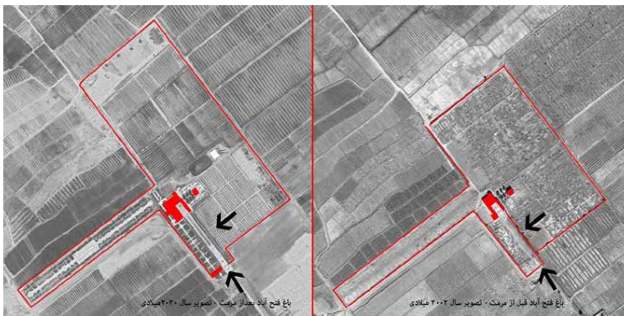
تصویر ۳. تصاویر هوایی قبل و بعد از مرمت باغ فتح‌آباد. فلش‌ها محل ورودی و دیوار جداکننده باغ‌اندرونی و بیرونی را نشان می‌دهد.

این سه‌بخشی‌بودن در متفاوت‌بودن باغ فتح‌آباد با آنچه ما از باغ ایرانی کلاسیک در ذهن داریم نقش دارد: نخست، هندسه حاکم بر کلیت باغ است که محدوده‌ای