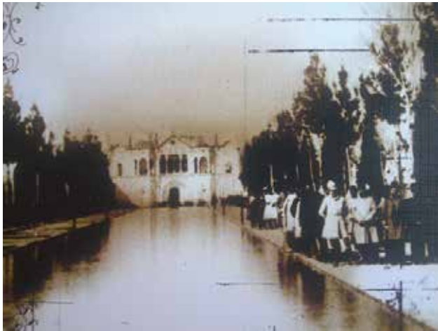
تصویر ۴. نخستین تصویر از باغ فتح‌آباد در دوره قاجار که ردیف درختان در محور اصلی باغ را نشان می‌دهد. مأخذ: سلطانه‌زاده و گنجویی، ۱۳۹۳، ۴۵.