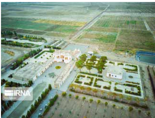
تصویر ۱. باغ فتح‌آباد کرمان بعد از مرمت و بازگشایی، مأخذ: www.Irna.ir

۱. خیابان اصلی با ورودی و کوشک اصلی در دو سر آن که با درختان کاج و سرو، جوی‌هایی در دو طرف خیابان و حوض‌هایی در وسط محور خیابان در نهایت دقت کار و تزئین شده‌اند. دید و منظر کوشک اصلی به سمت این خیابان در نظر گرفته شده است. کرت‌های کناری خیابان اصلی در سمت غرب نیز در این بخش از باغ قابل تقسیم‌بندی است. درواقع می‌توان گفت این بخش از باغ نقش باغ بیرونی یا عمومی مانند اتفاقی که در باغ دولت‌آباد یزد و یا جهان‌نمای شیراز افتاده بوده است را برای باغ فتح‌آباد دارد (بنگرید به پیرنیا، ۱۳۷۳). نقش قنات و شبکهٔ تقسیم